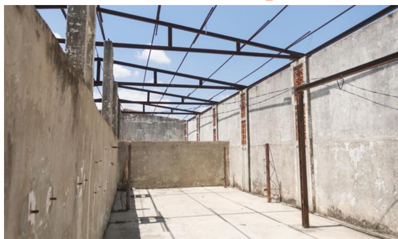
Luego de varios años en desuso el gimnasio múltiple de San Luis presenta estas condiciones

Aunque la participación de personas de la tercera edad en las