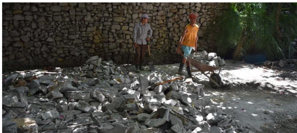
La demolición y acarreo manual de escombros es una de las faenas que demanda mayor desgaste físico de los hombres