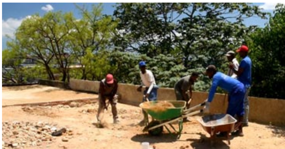
La impermeabilización del techo es una labor compleja y de ella depende que todo el trabajo no sea en vano

Anticipar la disponibilidad de todos estos recursos será la garantía para, una vez terminada la construcción civil, poder en poco tiempo reabrir sus puertas al público.