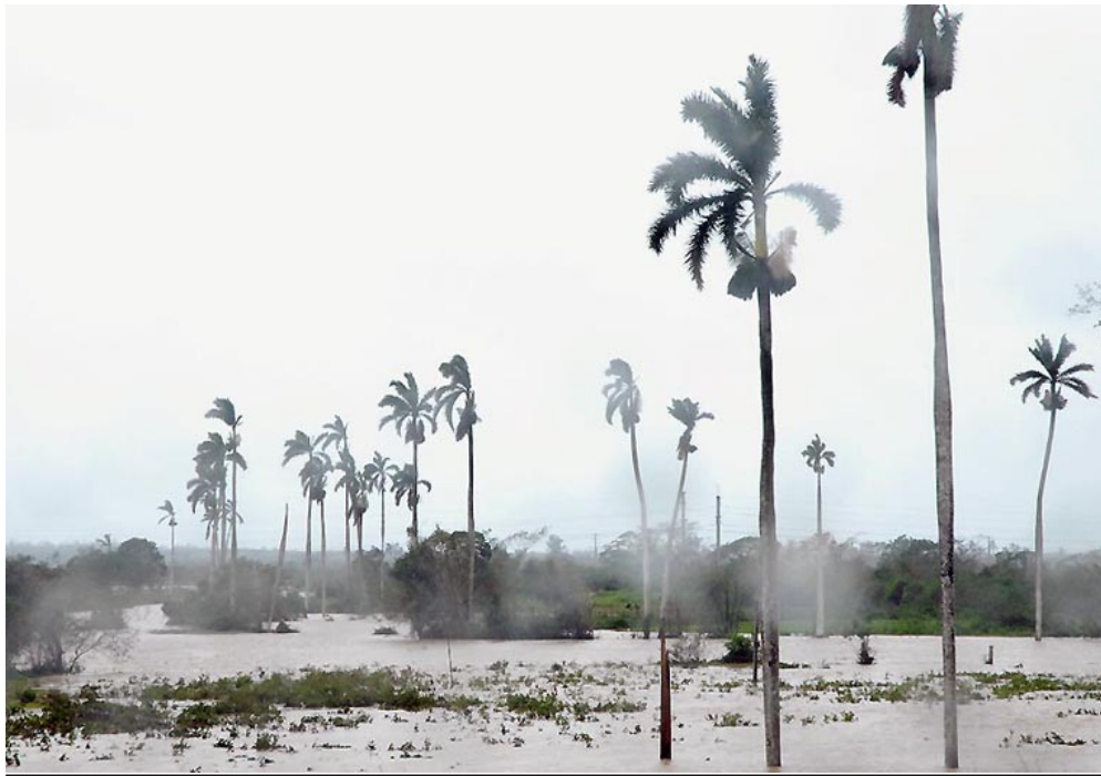
Estar preparados para enfrentar los ciclones está dentro de las acciones a realizar en el Meteoro 2017.