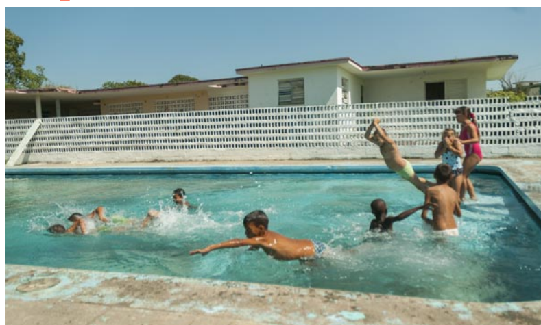
A solo unos meses de su puesta en función, la piscina de El Corajo ya aporta talentos

Además del área de cultura física, el local cuenta con otras dos destinadas a prestar servicios terapéuticos a estudiantes que no son completamente eximidos de la asignatura de Educación Físi-