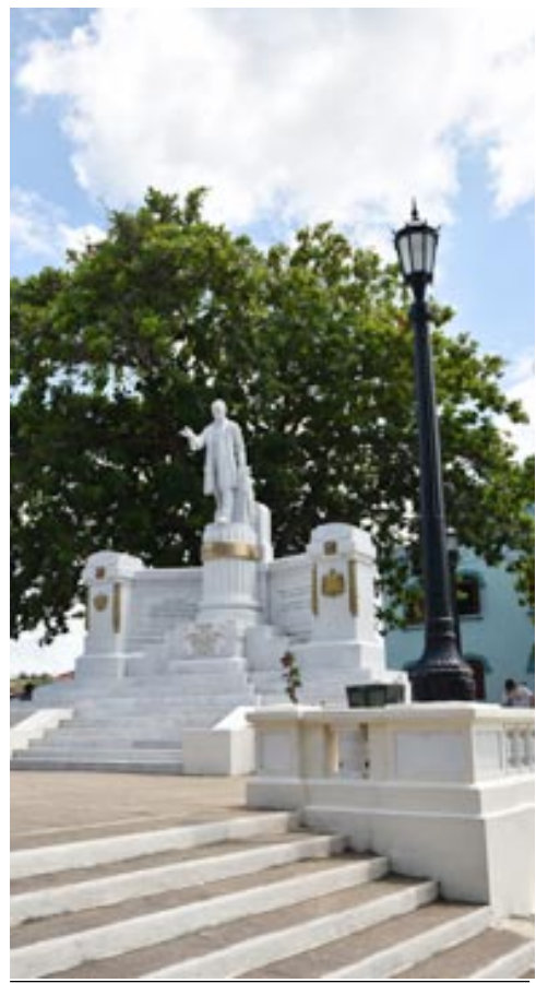
Desde el parque José Martí partirá el desfile inaugural del evento hasta el de la Independencia

El evento identitario Nosotros, diseñado inicialmente para realizarse en el mes