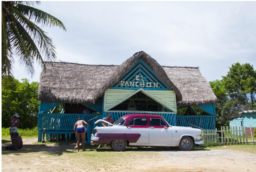
Los ranzones de Boca de Galafre permanecen surtidos durante el verano, pero cada año tienen una presencia más deteriorada

Este verano llega a su final, como cada año, acompañado por sus más de 30 grados Celsius. Las dos playas de mayor afluencia en Pinar del Río cerrarán una temporada veraniega y quizás el próximo año podrán abrir otra más atractiva, pero queda en manos de los encargados la responsabilidad de marcar la diferencia en el 2018.