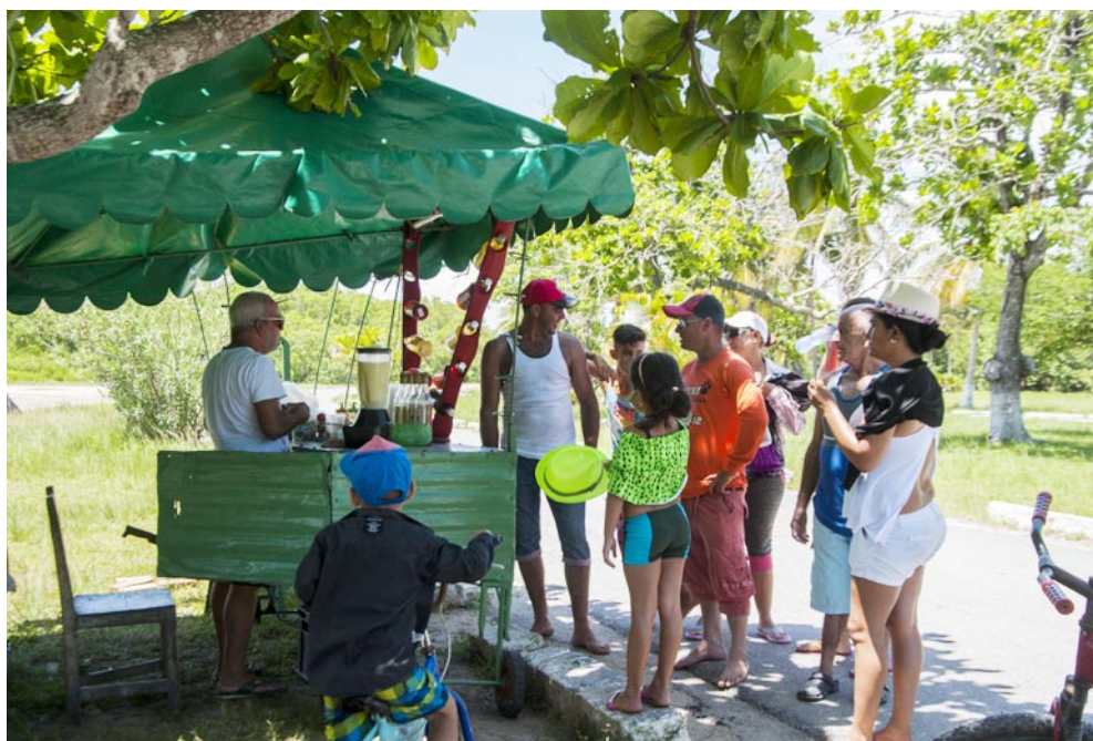
Las ofertas de los cuentapropistas son estables durante los meses de verano en ambas playas