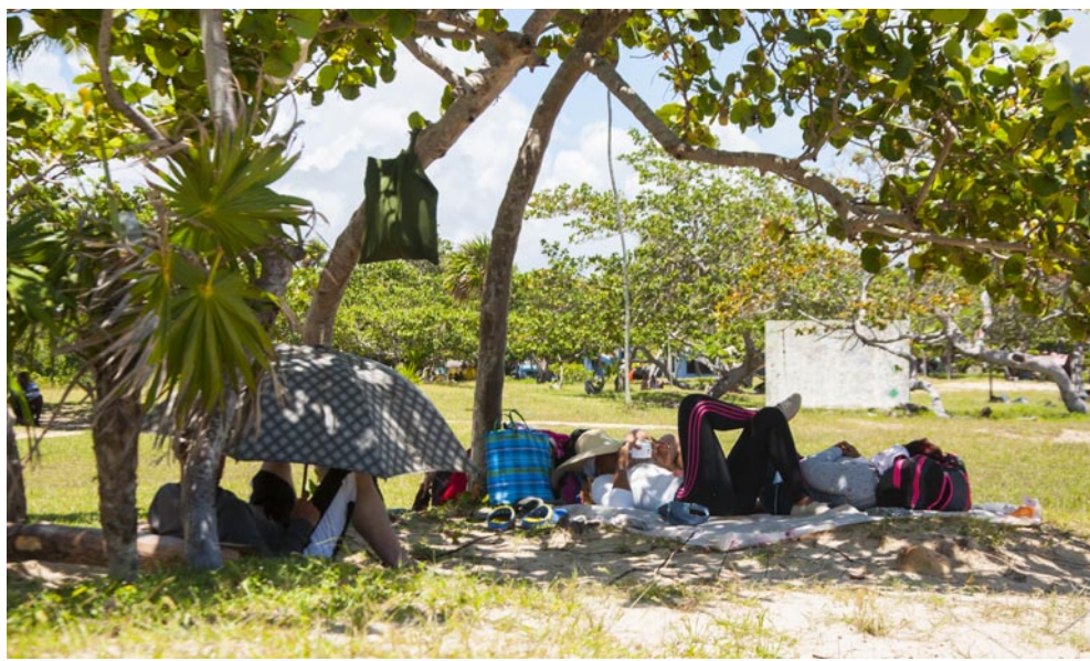
La ausencia y el estado de las sombrillas dificultan la estancia de los bañistas