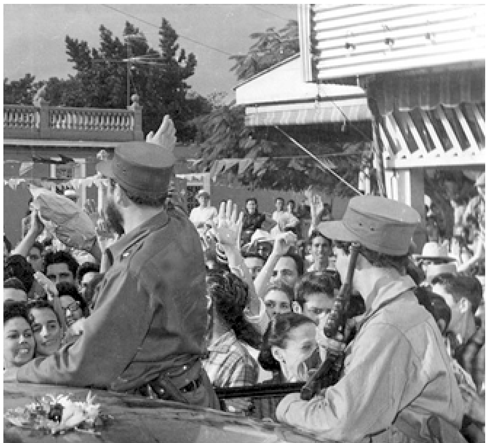
La esquina de las avenidas José Martí y Rafael Ferro ha sido escenario de momentos trascendentales, como el primer discurso de Fidel a los pinareños, y será allí donde se realice la gala político cultural por el aniversario 150 del otorgamiento del título a la ciudad

En estos cuatro días de festejos, rindamos homenaje a nuestros ancestros, pensemos la ciudad y proyectemos para el futuro los planes a realizar, pero sobre todo detengámonos a contemplarla e interiorizar la necesidad de protegerla, para que a su amparo en tiempos venideros crezcan hombres y mujeres que sean herederos de virtudes y de un patrimonio tangible sobre el cual sustentar el orgullo por sus raíces.