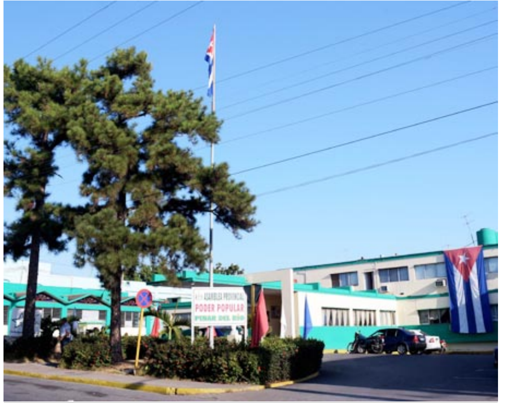
En la sede de la asamblea Provincial del Poder Popular sesionará el evento teórico Ciudad Pinar del Río: historia, patrimonio, arquitectura y desarrollo local

Jueves y viernes en la sala del "Milanés", a las nueve de la noche, el público disfrutará de humor con Kike Quiñones; en el mismo horario el sábado se desarrollará una gala político cultural en la avenida José Martí y el sitio escogi-