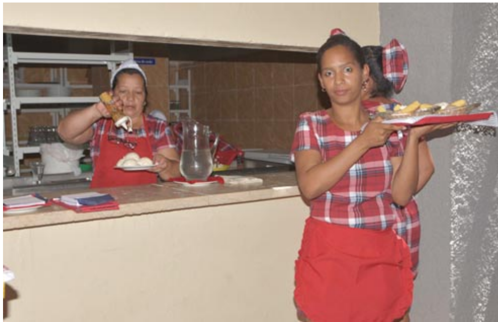
La nueva imagen de las trabajadoras también forma parte del proceso de revitalización de la unidad