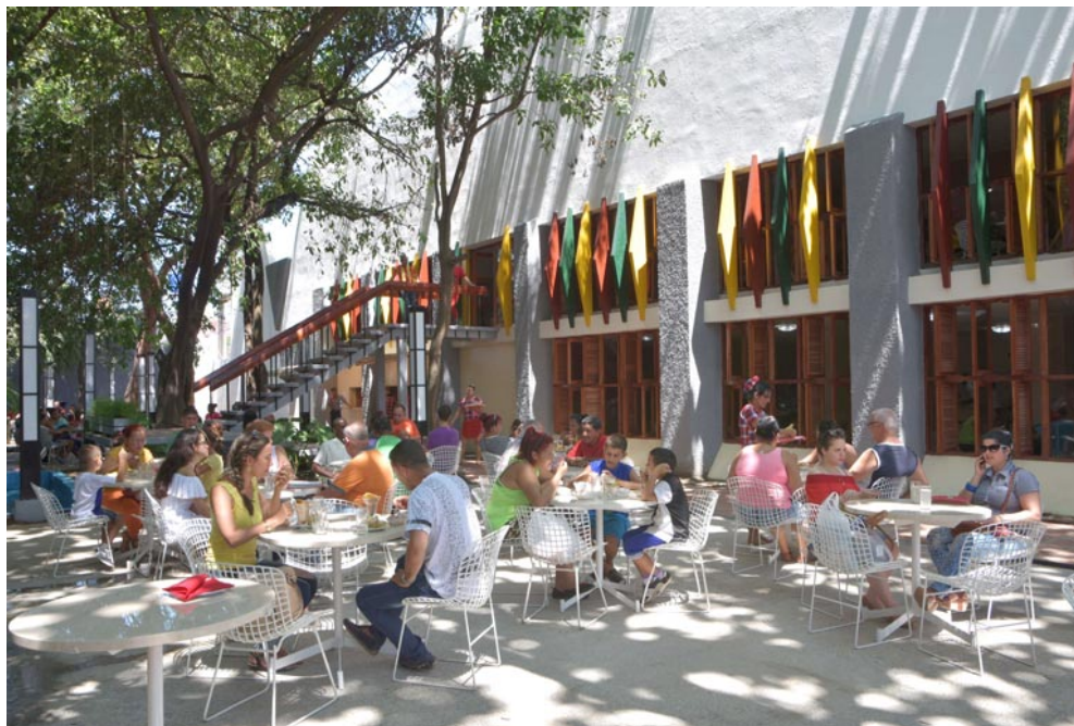
El patio fue uno de los sitios totalmente reconstruido durante la remodelación