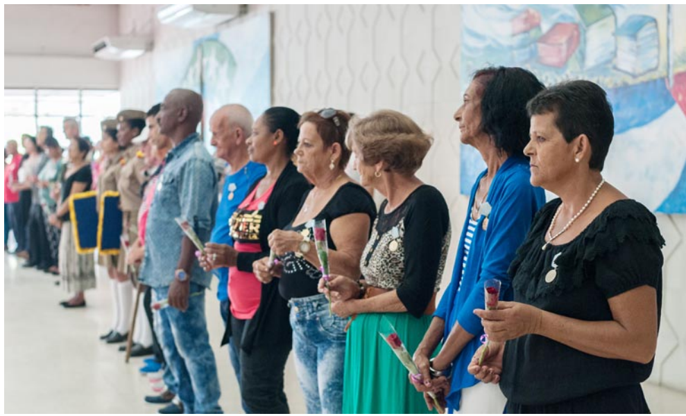
Un grupo de cederistas recibieron reconocimientos de la organización