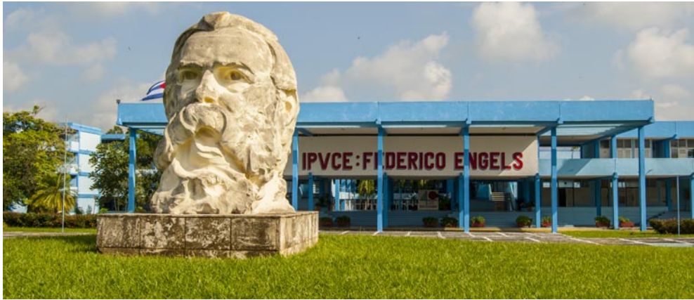
El Premio del Barrio será entregado al IPVCE el próximo 26 de septiembre

Por Dayelín Machín Martínez y Ana María Sabat González