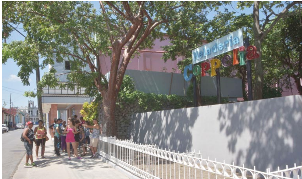
Pocos minutos después de la apertura ya se aglomeraban los clientes para disfrutar de las ofertas de Coppelia

Una ciudad hermosa, con ciudadanos más felices, ese es el propósito central de todo lo hecho por el siglo y medio de existencia de la urbe.