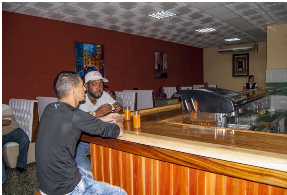
La decoración del Hotel Italia estuvo a cargo del proyecto Fidas

Las opciones son de pizzas y espaguetis en sus variedades; además de entremeses, ensalada fría, dados de queso y