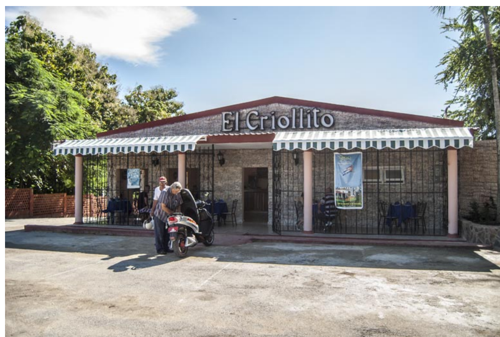
El Criollito es una de las primeras opciones para el consumo de los pinareños que cohabitan en esa zona de la capital vueltabajera