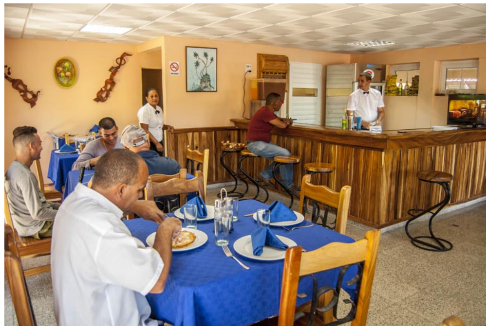
De ocho de la mañana a 11 de la noche presta servicios El Criollito

El directivo también informó que ya trabajan en la reconstrucción del restaurante Pío Pío, con el fin de darle el sentido inicial de su fundación con recetas a base de carne de pollo. De esa forma, la Empresa mejora sus instalaciones en el marco de este año de celebraciones.