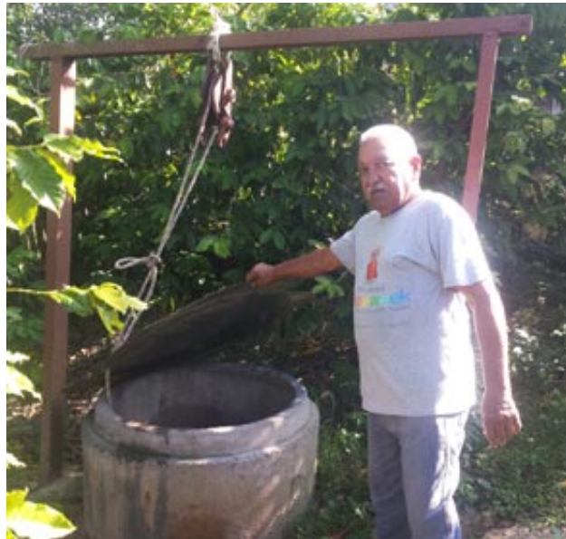
En pozos como este, los vecinos del Camino de los carretones cogen agua, con el riesgo de estar contaminada

necedor de la problemática, manifestó que a través de los años el país pudo ayudar con los recursos, los cuales se incluyeron en el plan de mantenimiento.