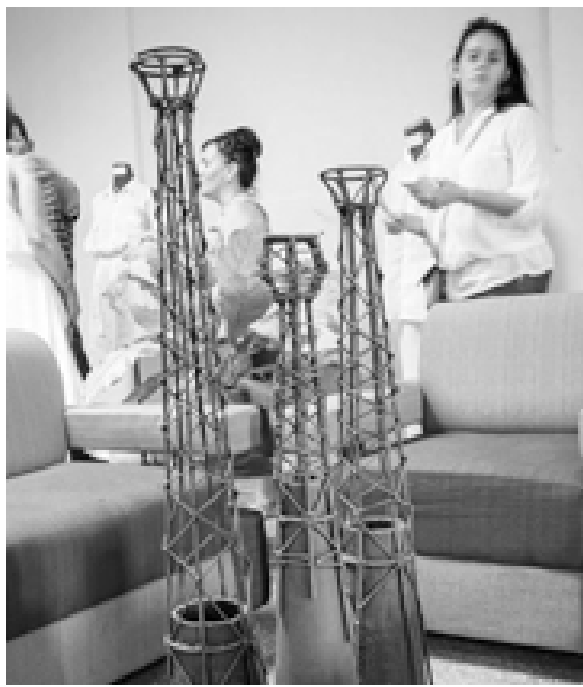
Las esculturas en metal y cerámica del grupo Cerart recibieron el primer premio

Varias de estas propuestas participarán en la Feria Internacional de Artesanía (Fiaart 2017) en representación de Vueltabajo.