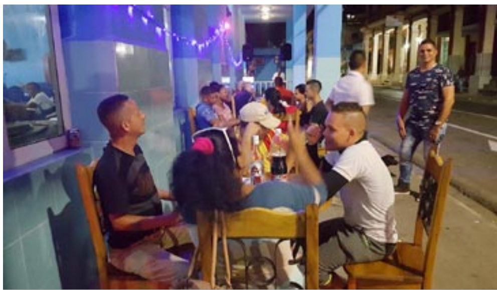
El olor y la música de El Marino amenizan la esquina de Martí e Isabel Rubio (Recreo)

Crece Pinar, se extiende y conquista horarios que antes estaban reservados solo para el silencio. Ya la ciudad está con más vida.