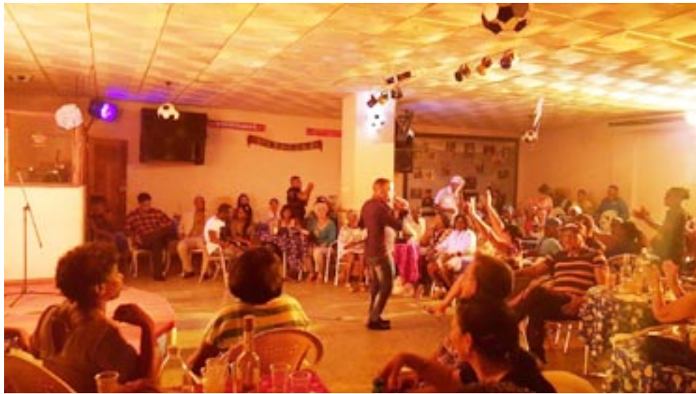
Los espectáculos interactivos con el público son una particularidad de las noches en el Super Gol

La unidad cuenta además con ofertas de pollo y cerdo con sus guarniciones. Ahora no faltan los líquidos comercializados en CUC y los vegetales.