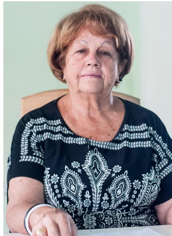
Distinciones, medallas y reconocimientos acompañan la vida de esta mujer educadora, dirigente e investigadora, quien ostenta la categoría de máster en Ciencias de la Educación

"Siempre he dicho que con un director exigente y con maestros capaces, hay una buena escuela. La disciplina la diseña en su parte inicial la familia y la sigue desarrollando el centro escolar, que cuenta con métodos y estilos de trabajo para transformar a ese joven, para que su comportamiento sea mejor, nosotros también somos responsables".