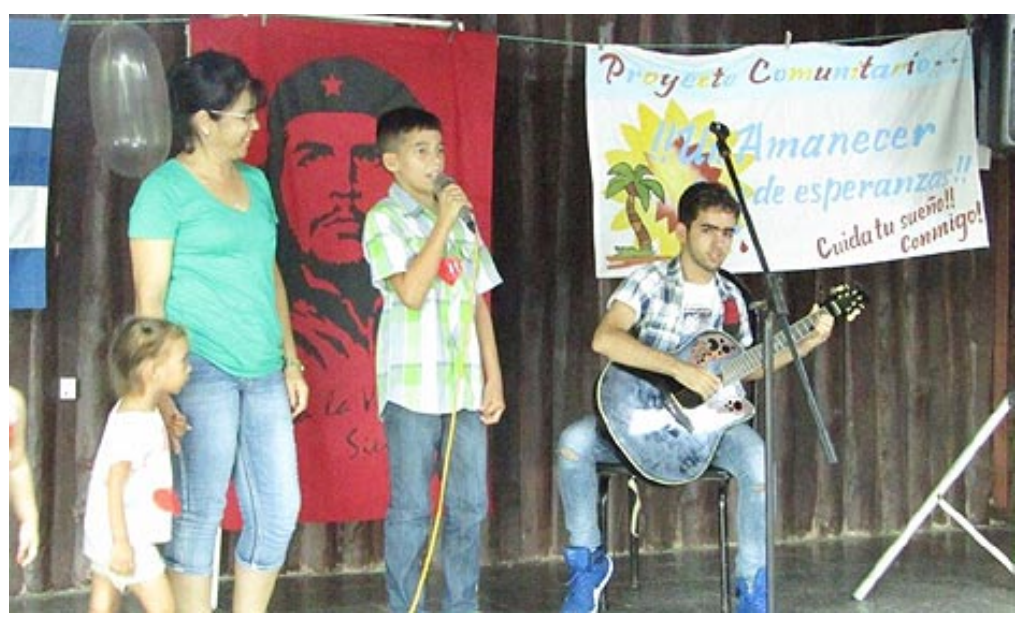
El aprendizaje musical es un bien apreciado por los jóvenes