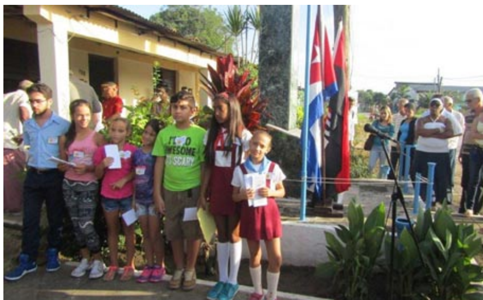
El sustento político que necesita la sociedad

Esas son las familias que necesitamos, ahí se forja el hombre nuevo.