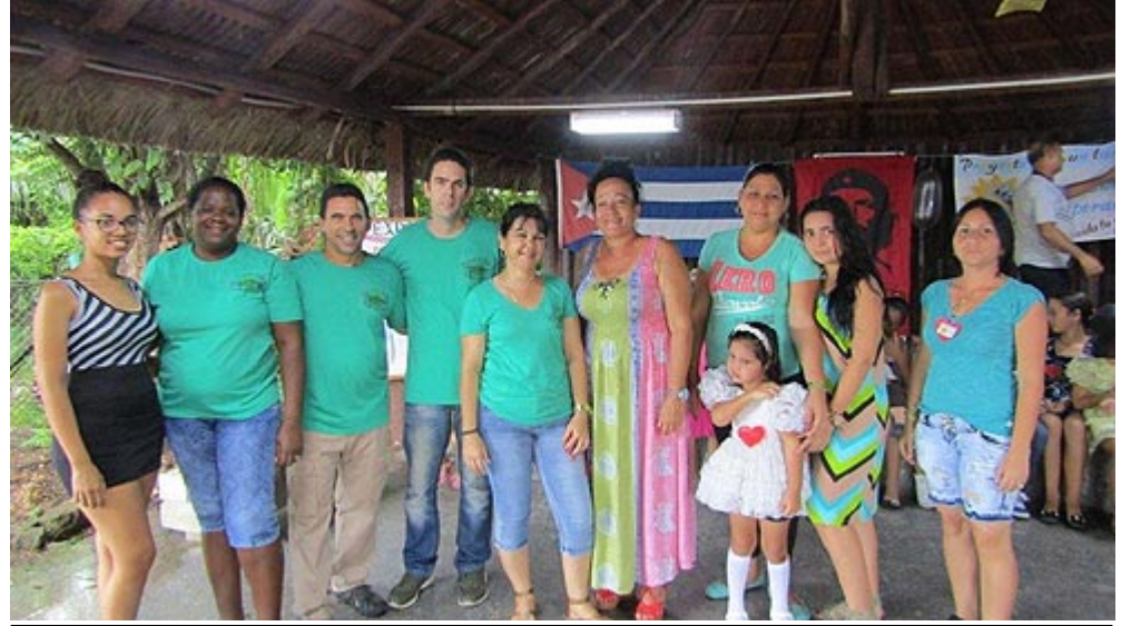
Algunos de los gestores

El peso del trabajo se redistribuye sobre los hombros de los gestores, que son los artífices de la música, las artes plásticas y manualidades, de la danza y el estudio político, los que buscan los cakes para los cumpleaños colectivos aunque los huevos estén difíciles; quienes engalanan un patio u organizan un desfile de mascotas con perros, gatos, jicotea y hasta un guanajo; los que idean los disfraces o un karaoke, pero también le dan un sentido patriótico a lo que hacen.