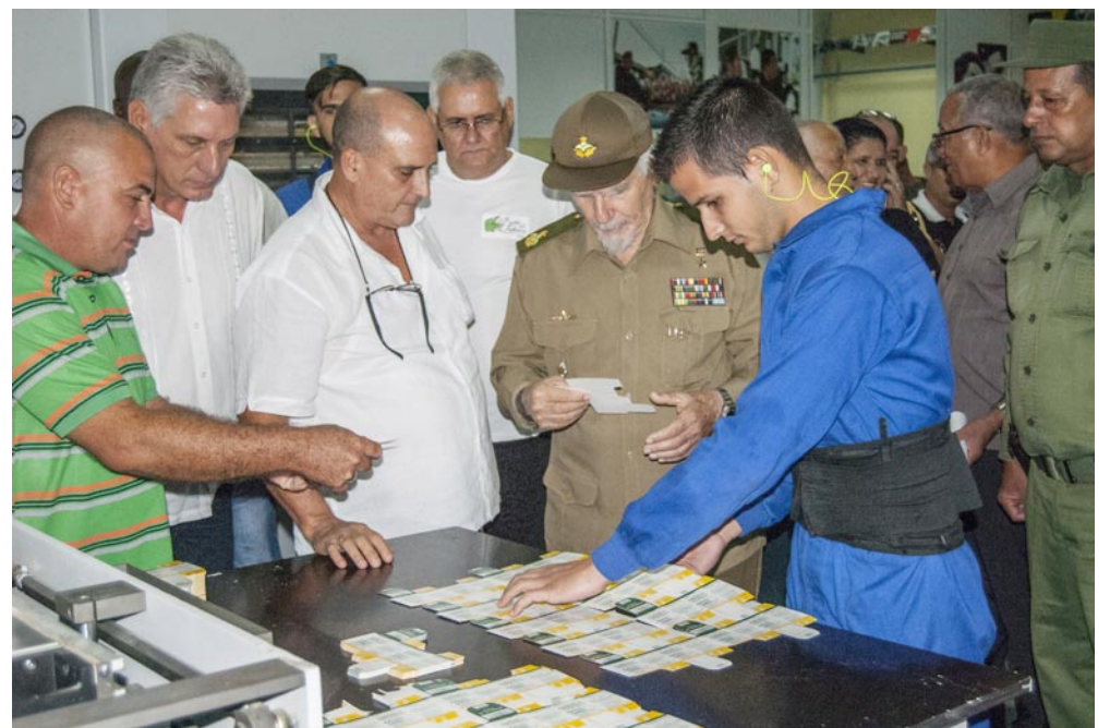
Los vicepresidentes Miguel Díaz-Canel y Ramiro Valdés visitaron en octubre la Agencia de Envases Plegables

Actualmente cuentan con 36 trabajadores y se estima llegar más adelante a la cifra de 70 empleados. Una buena fuente de empleo para Vueltabajo, y otros valores agregados que consolidan el desarrollo de la provincia.