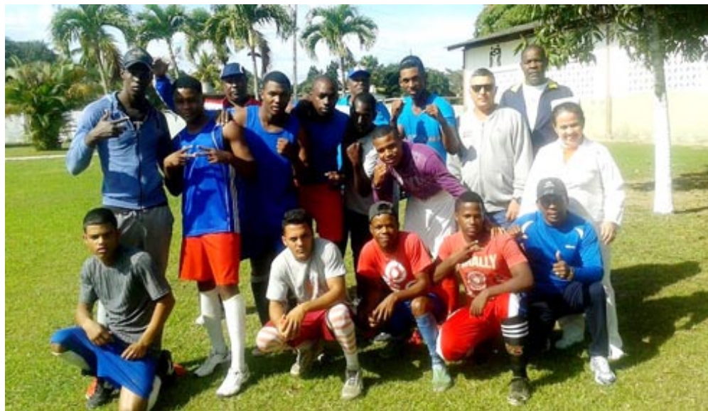
Parte del equipo y del cuerpo técnico de Gladiadores, antes de una sesión de entrenamiento en la academia Abad Méjico

Si bien persisten detalles por mejorar en la preparación metodológica y científica de los profesionales ligados a este deporte, carencias logísticas por subsanar y procesos de captación de talentos en los que ser más rigurosos, lo cierto es que el boxeo local continúa aportando logros dentro y fuera de nuestras fronteras.