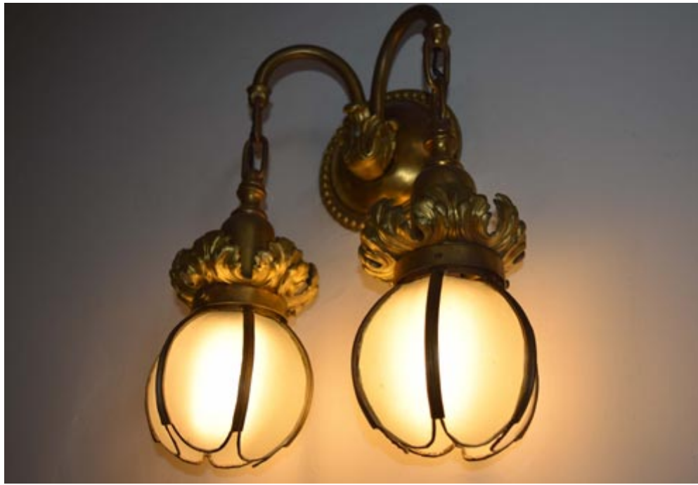
La restauración de las luminarias confeccionadas en bronce, sin duda resalta la belleza de cada habitación recuperada

Por ello si además de cumplir con su encargo puede embellecer el entorno, pues mejor, máxime cuando es un baluarte arquitectónico. Y destaca Sierra Infante: "Hay mucho patrimonio e historia que conservar".