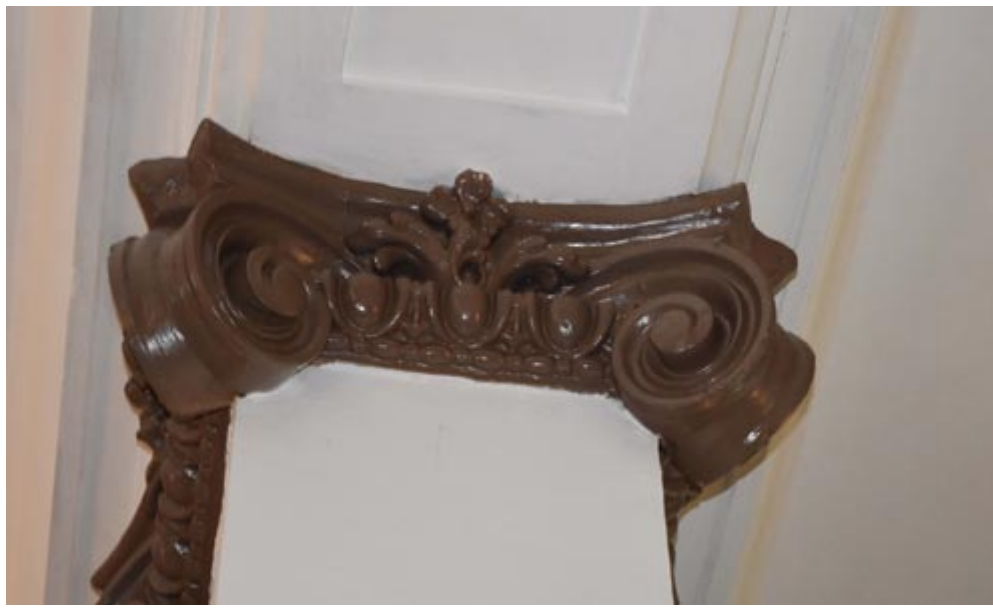
Los capiteles y techos exigieron de un riguroso trabajo para devolverles su imagen inicial