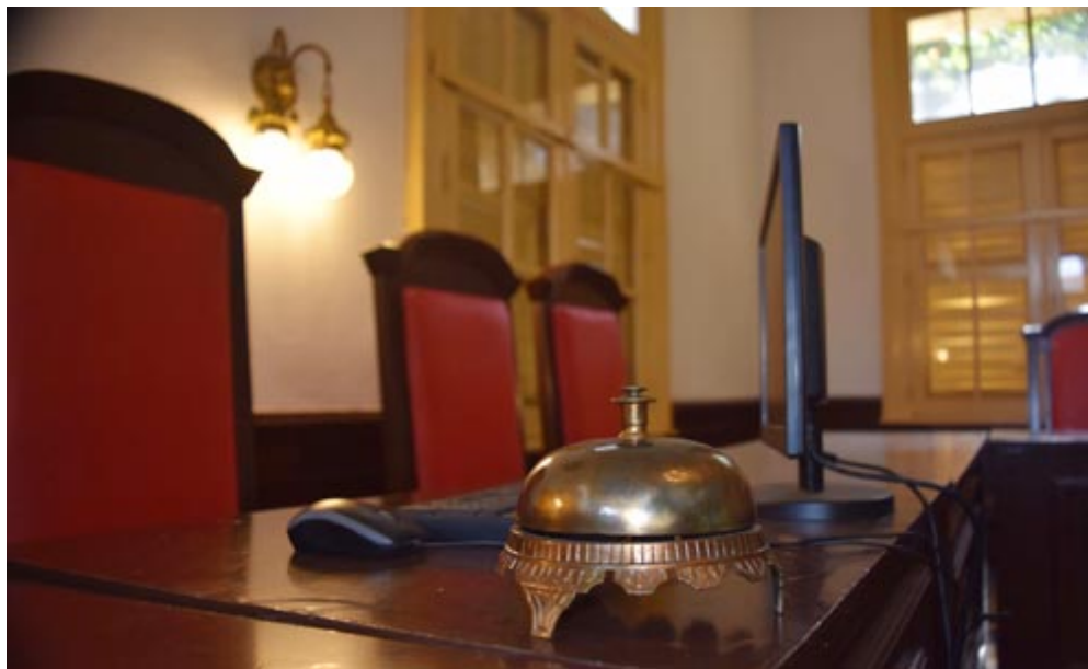
Engarce de lujo entre pasado y futuro