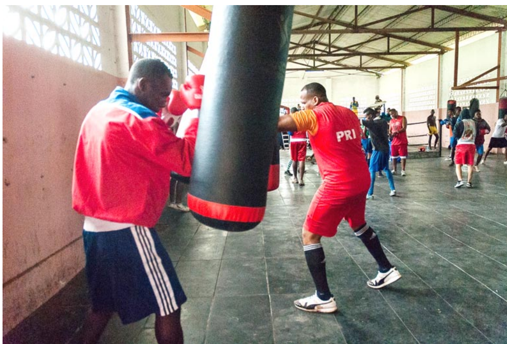
Durante el entrenamiento con miras a la Serie Nacional de Boxeo

Ello no quita; sin embargo, que, como la mayoría de los deportes en la Isla, se