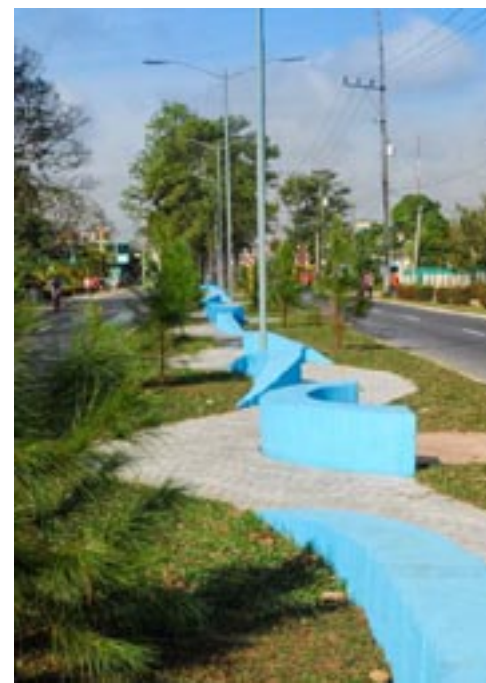
Poco a poco se transforma la provincia como parte de la utilización del aporte del uno por ciento