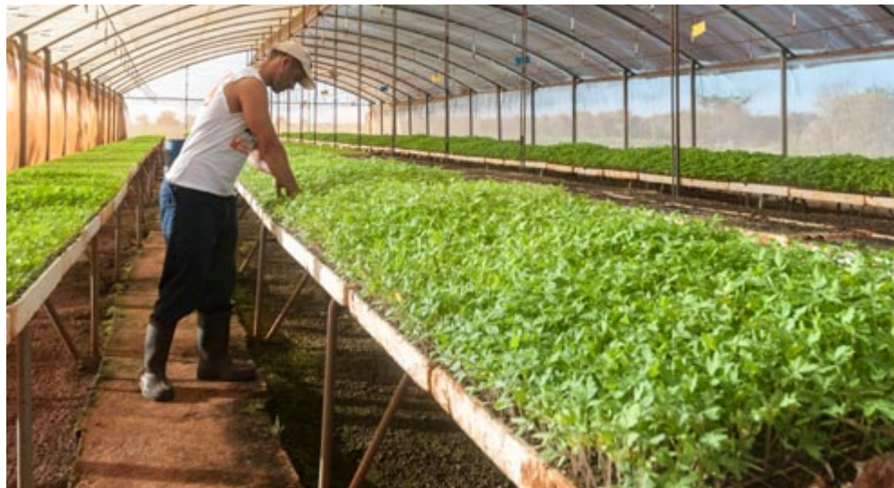
Las resiembras están dentro de las actividades que realizan los pocos trabajadores de la finca de semillas