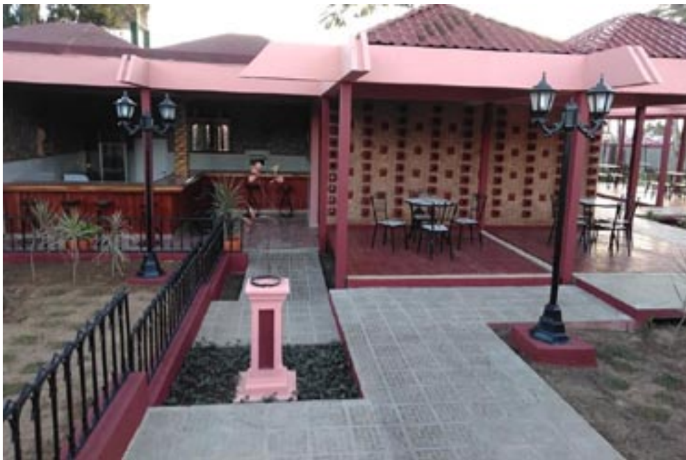
Varios centros gastronómicos de la capital fueron rescatados el pasado año gracias al aporte del uno por ciento, como es el caso del Pío Pío

Si se habla de contribución territorial, obligatoriamente debe mencionarse la ce-