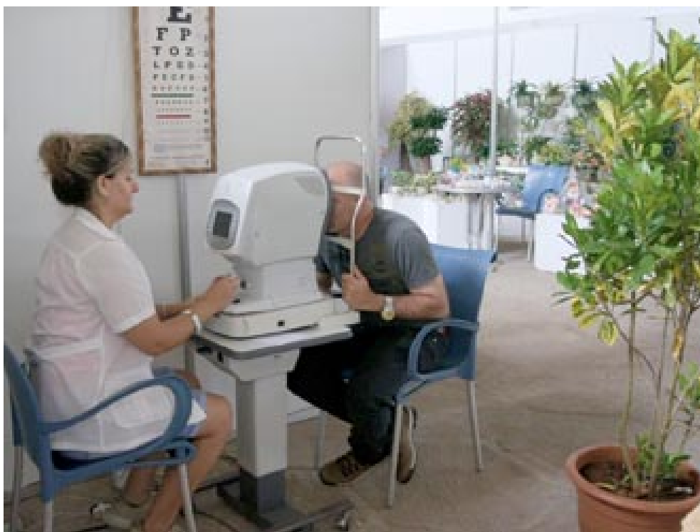
Salud mereció el premio a la popularidad e integralidad. Su entusiasmo, alegría y profesionalidad dan vida a la muestra