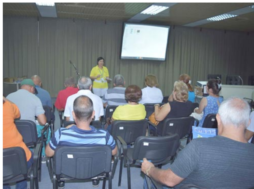
Incorporar un programa teórico a la exposición la convertirá en un espacio para el diálogo y el intercambio profesional

La convocatoria a la X edición De Pinar te traigo... ya está abierta y no será tarea fácil, porque superar la precedente requerirá de minuciosidad, no es tarea imposible y los pinareños bien saben crecerse sobre sí mismos.