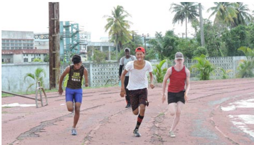
Los chicos en una de las sesiones de entrenamiento en la pista de la Eide Ormani Arenado

Hoy su esfuerzo se ve recompensado con dos medallas de oro alcanzadas el pasado año en Las Tunas, en las modalidades de salto de longitud y 400 metros