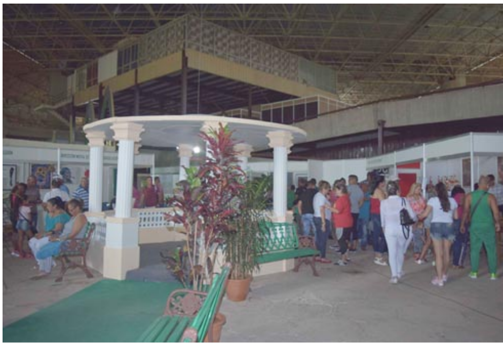
Vista general de la exposición De Pinar te traigo...