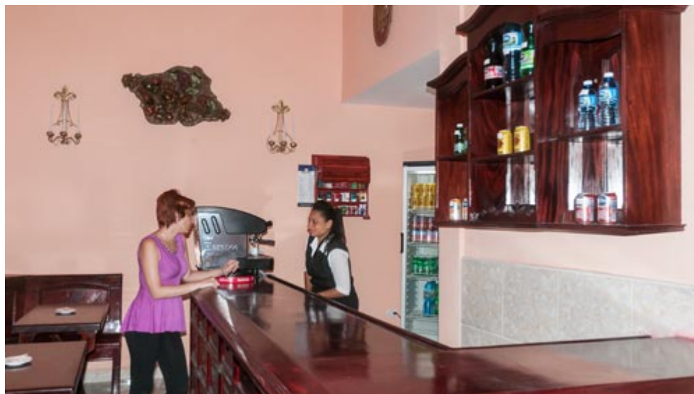
El pequeño bar de la planta baja es una de las novedades del "Globo"