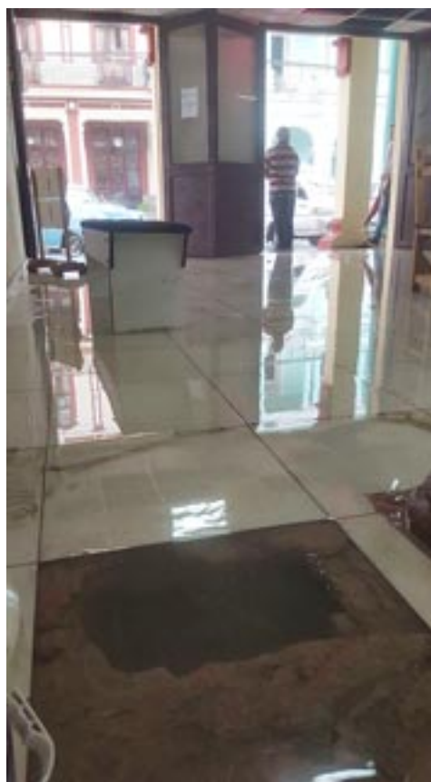
Los registros tupidos provocaron la inundación del local

El directivo aclaró que en el caso de las unidades arrendadas como la Reloje-