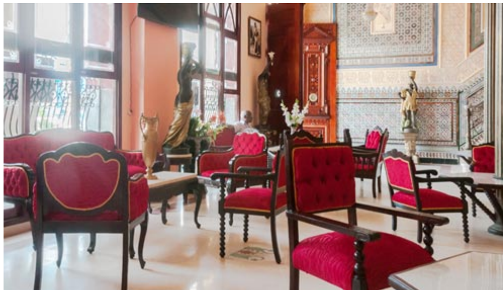
La decoración y mobiliario estuvieron a cargo del proyecto Fidias y en la construcción trabajó una cooperativa no agropecuaria de la Isla de la Juventud

En tanto, para las habitaciones se pretende desarrollar un proyecto que incluya primero la reparación de las exteriores, que dan para la avenida José Martí y la calle Isabel Rubio (Recreo), la cuales hacen un total de 13 de las 42 que tiene el hotel.