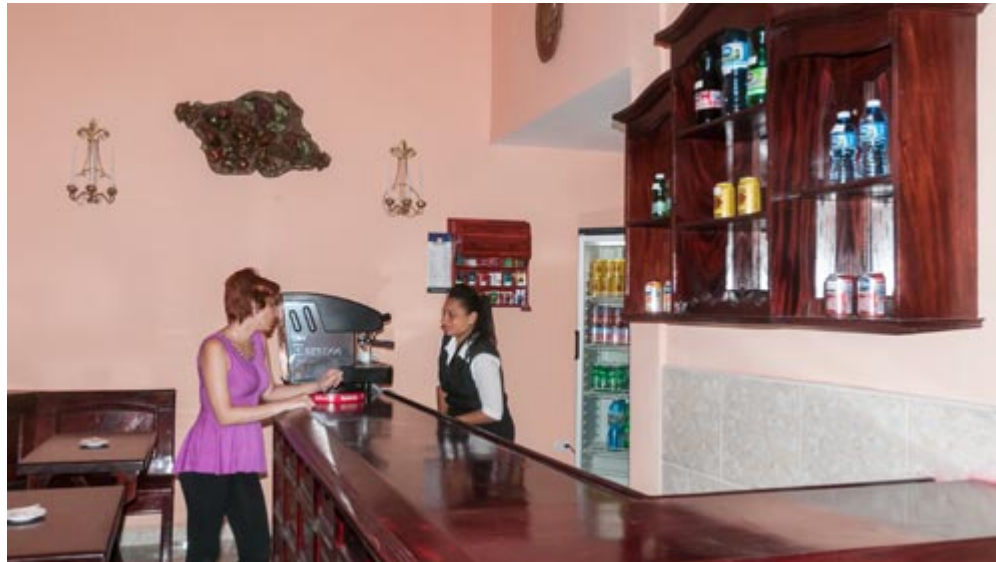
El pequeño bar de la planta baja es una de las novedades del "Globo"