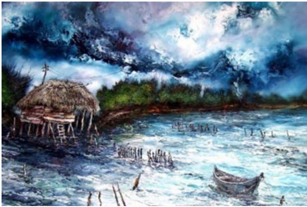
Obra de Humberto Hernández Martínez

Raúl referencia la vida portuaria en La Coloma. En su obra subyace el elemento humano y social. Le interesa el paso del tiempo, la acción inconmensurable de la natura-