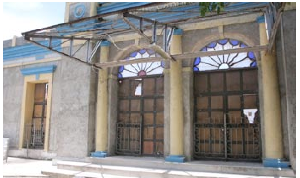
Aunque en la terminal ferroviaria se han realizado algunas acciones, todavía queda mucho por hacer

A buen ritmo marcha la remodelación del parque Antonio Guiterras, donde hasta las áreas aledañas cambiarán su imagen con la ampliación de la zona de estar, así como pintura a las fachadas de las viviendas, penetración invertida al camino e inclusión de una pintura mural, acciones que realzarán el entorno.