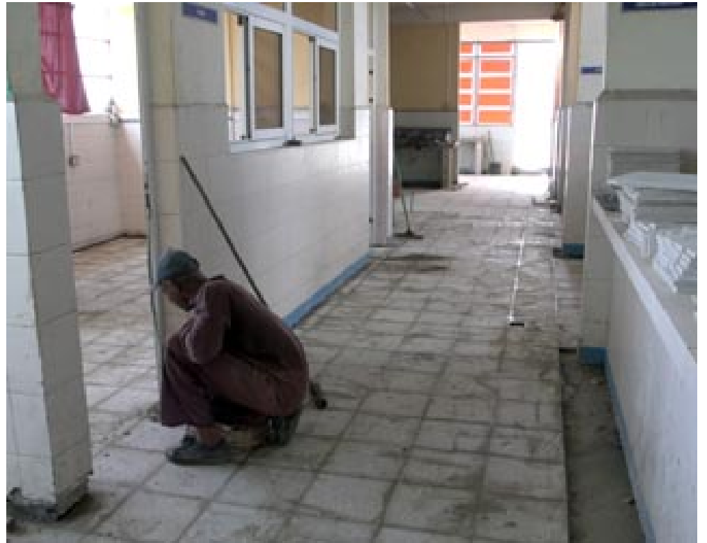
La colocación del piso en la cocina del 12 Plantas es precedida de la certificación de calidad a las conexiones hidráulicas

Si bien es cierto que hay precedentes desfavorables, hoy el esfuerzo se concentra en no dejar fisuras. Valdés informó que ya están en contacto con las personas que las filtraciones les provocaron deterioro en sus viviendas, y asumirán la subsanación de las mismas.