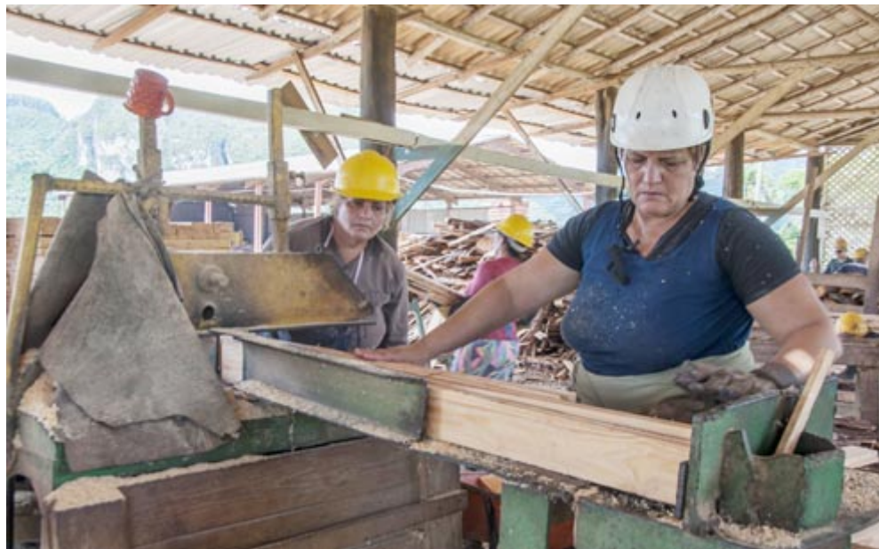
Más de ocho mujeres trabajan en la producción