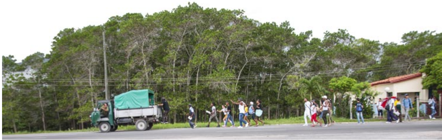
Esta es una escena común en los puntos de recogida de pasajeros. La indisciplina de algunos choferes lleva a que impere la ley del más fuerte entre los que tienen necesidad de viajar

Por Yurina Piñeiro Jiménez, Heidy Pérez Barrera y Daima Cardoso Valdés