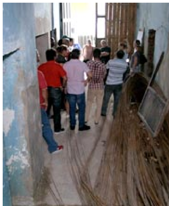
En la sede del proyecto artístico Picart, los coordinadores ofrecieron detalles, sobre el cronograma constructivo y el futuro diseño de prestación de servicios

El objetivo primordial es ofrecer soluciones y comprobar in situ que se cumple con lo establecido. Las líneas rectoras siguen siendo las mismas: calidad, funcionalidad y acciones integradoras de alcance en cada entorno donde se intervenga, para que la transformación urbanística tenga mayor eficacia.