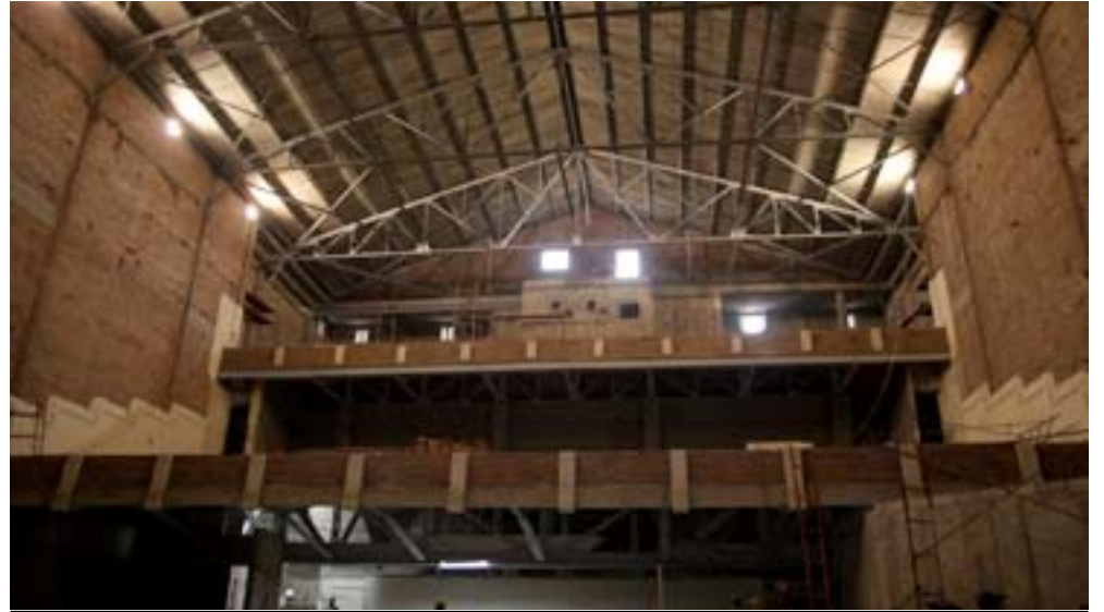
En el piso superior estarán las salas de pequeño formato, que lo mismo servirán para proyecciones en 3d, que para teatro de pequeño formato o conferencias

De la calidad con que lo hagan dependerá que en el futuro pueda mostrar la multiplicidad de opciones diseñadas y que cuando esté listo para ello sea explotado al máximo.