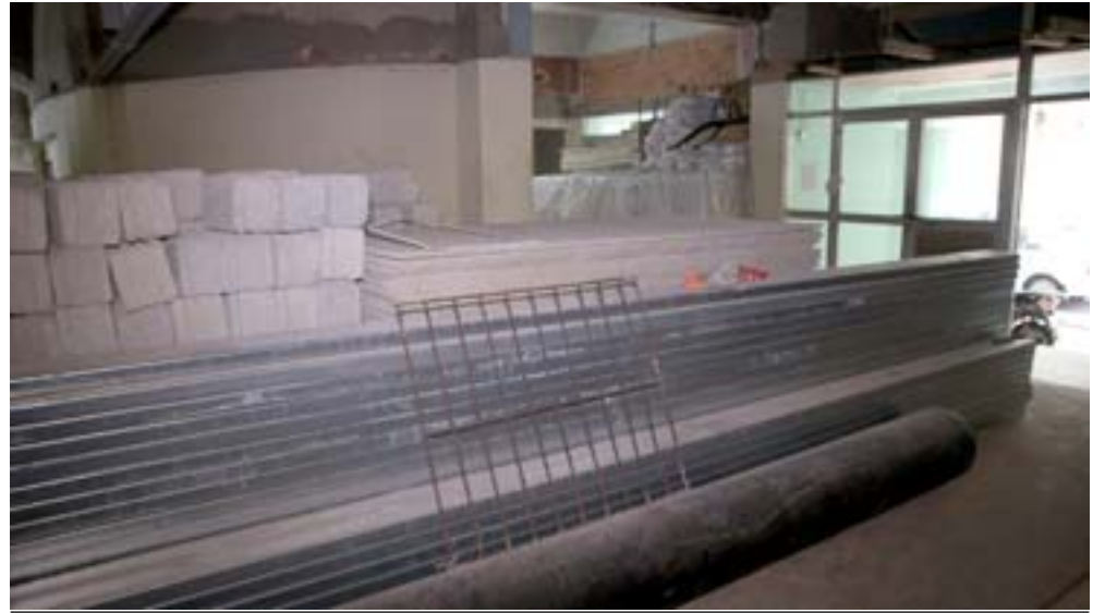
La inclusión de la barra es uno de los elementos que le permitirá funcionar como discoteca