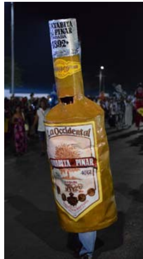
Tradiciones culturales e historia, somos un pueblo orgullosos de sus raíces