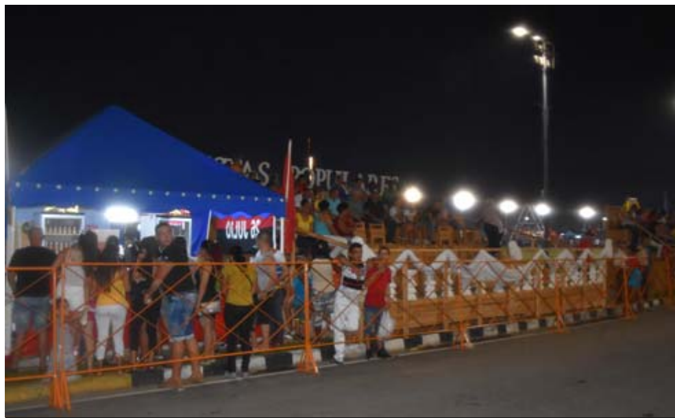
La colocación de quioscos junto a los estrados, es una opción que los espectadores acogieron con agrado