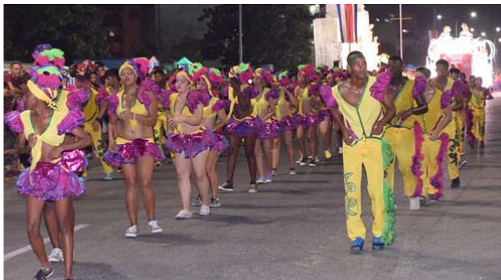
Coreografías más elaboradas, mejores vestuarios, realzan el desfile