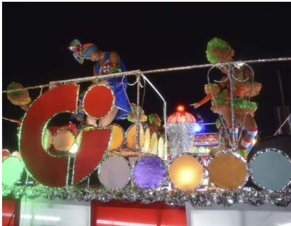
Las carrozas, una de las atracciones que genera mayor expectativa entre el público