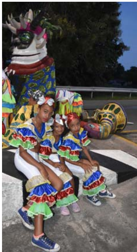
La presencia de los pequeños en comparsas ya es habitual, el domingo serán los protagonistas del carnaval infantil

Oderquis Revé, Tania Pantoja y Dan Den, son algunas de las agrupaciones que amenizarán los bailables en la Plaza de la Revolución.