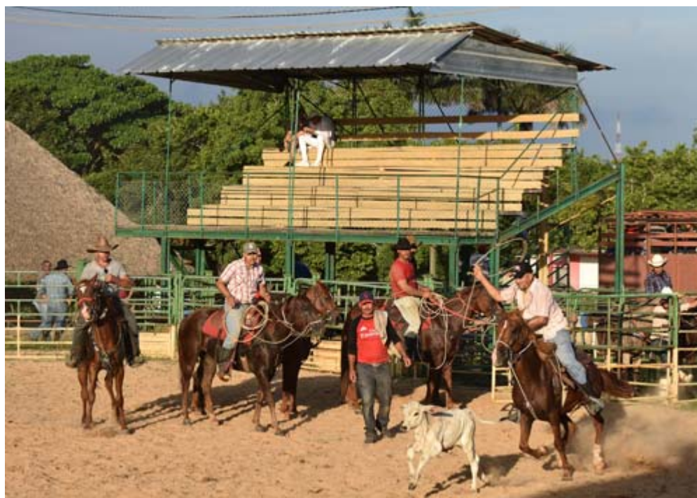
En el área El Rodeo la Empresa Municipal de Gastronomía Pinar del Río y la Pecuaria Punta del Palma aúnan esfuerzos para ofrecer variadas propuestas. Los amantes de la actividad lo agradecen