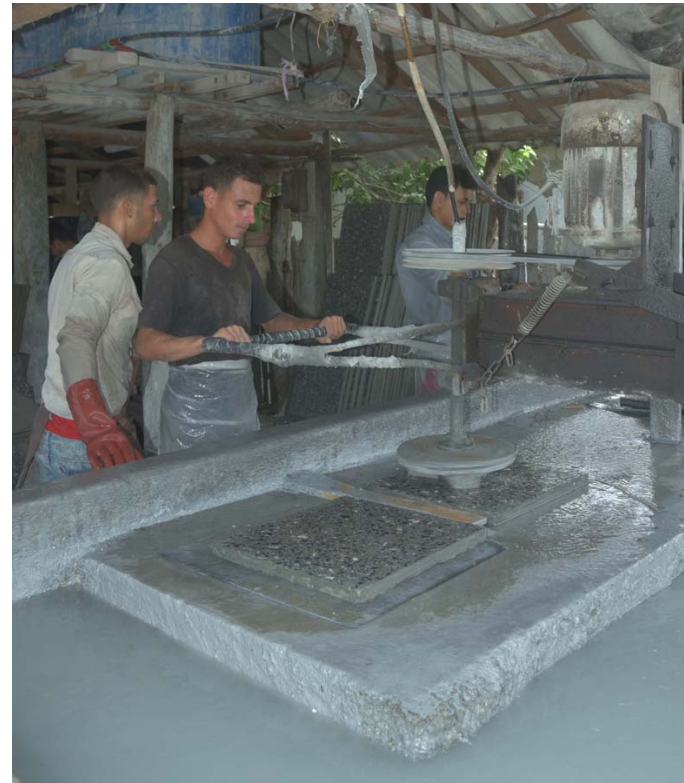
Las capacidades instaladas para la producción local de materiales de la construcción, con la participación empresarial y la no estatal, constituyen fortalezas del territorio.

Díaz-Canel comentó que Pinar del Río es la que más casos pendientes tiene desde el 2002 en la construcción de viviendas a damnificados por huracanes, a pesar del cumplimiento de los planes. Señaló que para las personas que están esperando es difícil ver cómo tienen solución casos de eventos más recientes en