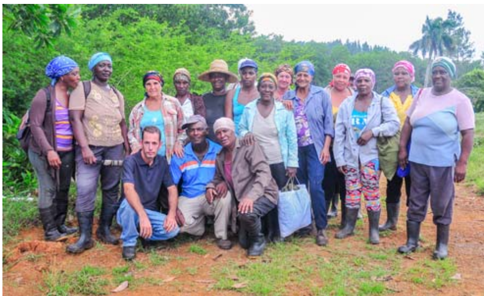
La calidad en lo que hacen prima en "Las Marianas"

B IEN intrincado en el lomerío, allí donde los pinares no te permiten ver más allá de la próxima elevación, una encuentra entre el sol y el sudor, un grupo de mujeres que no paran de reír a pesar del cansancio.