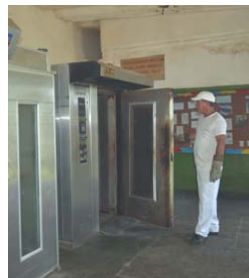
Los hornos y el inmueble presentan las huellas del tiempo, pero los hombres ofrecen su mejor imagen, como muestra de respeto a la profesión y a los consumidores

En el municipio no existe una tradición de maestros panaderos o legado que singularice la profesión, solo el buen hacer que vienen marcando un ejemplo que mucho se agradecería fuera multiplicado. Quienes ofrecen excusas banales para justificar la mala calidad del pan deberían mirarlos con sonrojo, porque si ellos pueden, otros también.