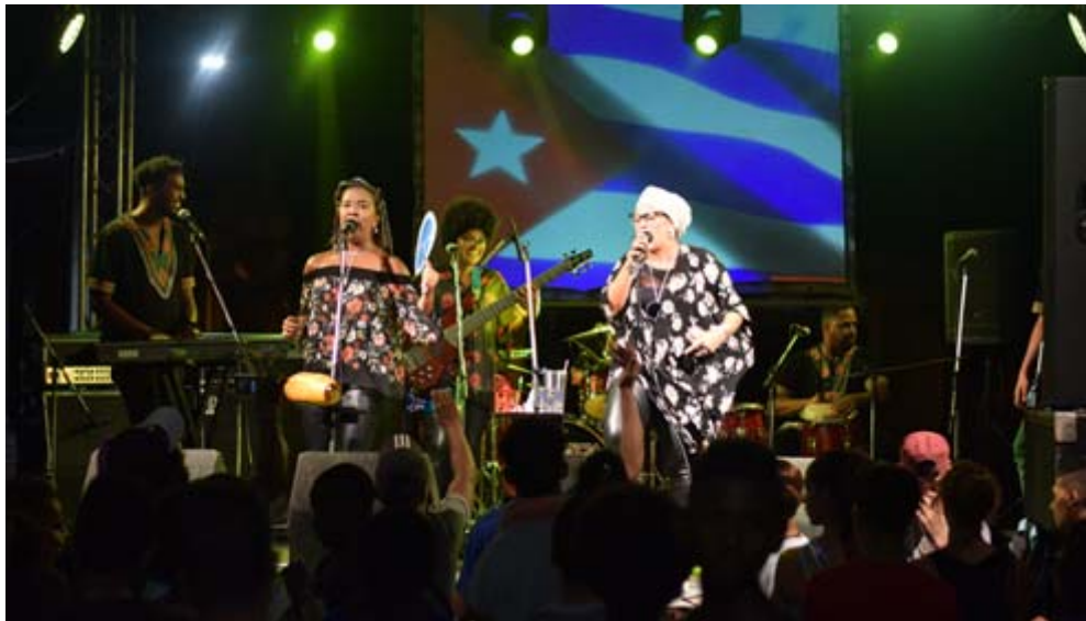
La política cultural ha de estar dirigida a que el pueblo tenga una oferta de calidad.

La política cultural ha de estar dirigida a que el pueblo tenga una oferta de calidad, rigor creativo y humanista y la política económica que se diseñe para la cultura deberá responder a esos propósitos y que los creadores, su familia y la población reciban los ingresos que se merecen por su obra. Es un todo complejo y articulado. La cultura se promueve y no se administra.