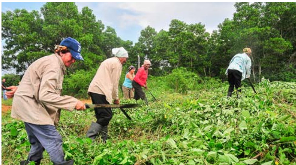
El granadillo es una de las plantas más complejas de eliminar para las mujeres de la brigada de silvicultura número Uno

Por Dorelys Canivell Canal