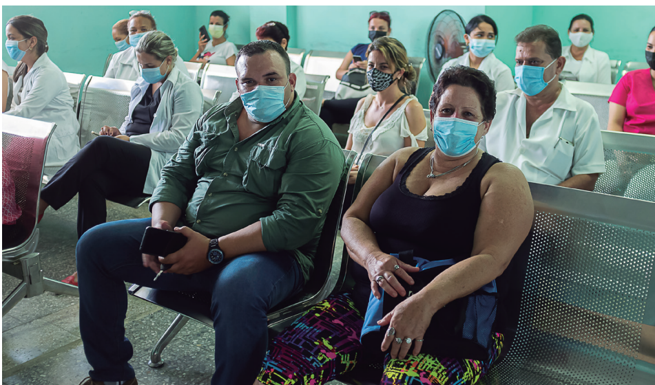
En las salas de espera se han creado las condiciones para la estancia de quienes aguardan su turno

Así, los 44 vacunatorios dispuestos en Pinar del Río reciben desde este martes las dosis de Abdala que llevan hasta los trabajadores de la Salud. Este candidato encierra en sí mismo, como dice la canción de Buena Fé, "la fe y la fuerza de un país, más protegido, más inmune, más feliz".