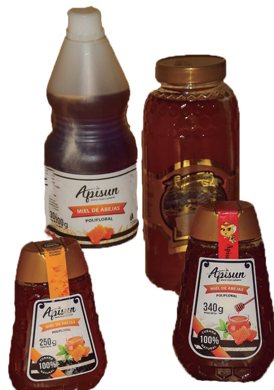
La miel que se destina a la población se comercializa en diversos formatos