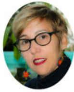
Por: Geidy Díaz Crespo

Por imperativos de la COVID-9, desde hace un año es el espacio virtual quien da cabida para la promoción de mensajes, artículos periodísticos o científicos y otras iniciativas que apuntan, más que a informar, a calar en los desaprendizajes de los pinareños hasta que incorporen, de una buena vez, que al ser humano no se le señala por sus actos, no por