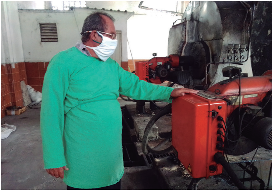
El trabajo en las calderas del hospital León Cuervo Rubio se torna vital para el funcionamiento de la institución

Texto y fotos: Raciél Guanche Ledesma, estudiante de Periodismo