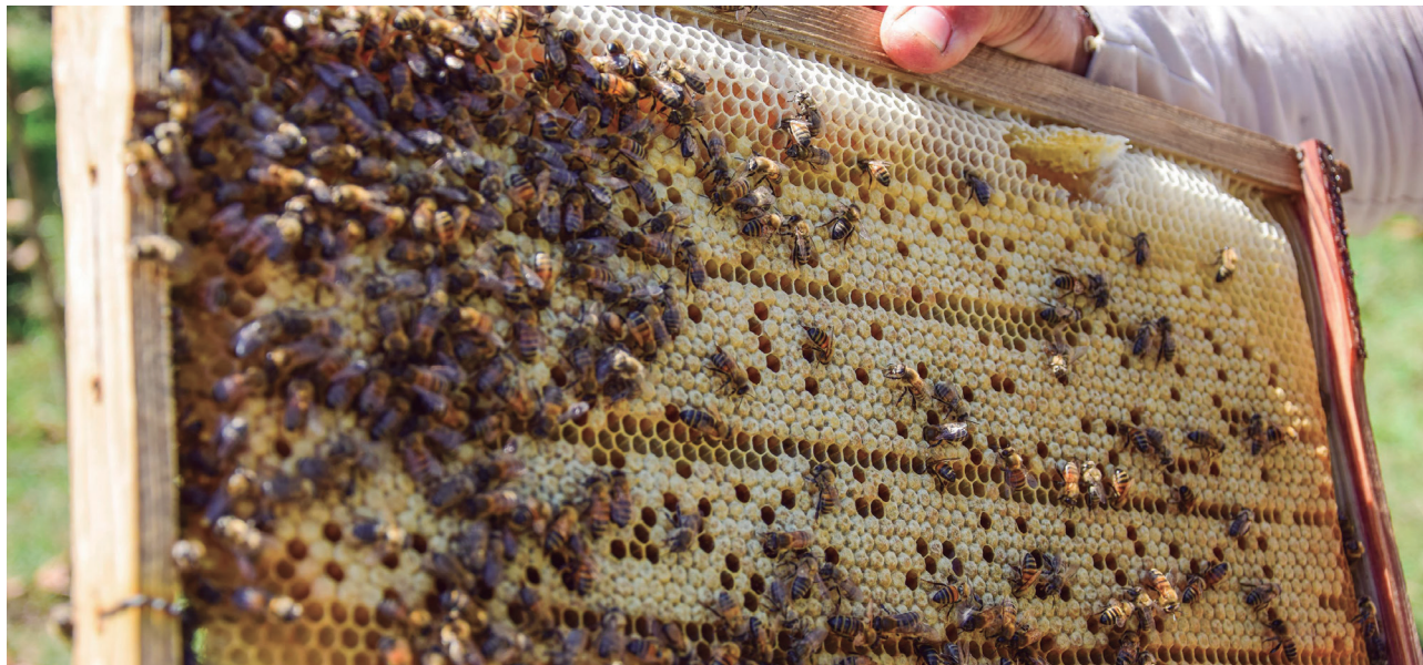
Las trashumancias y el cambio oportuno de la abeja reina son fundamentales para conseguir una buena cosecha

Reinas, obreras y zánganos hacen su parte en las 12 000 colmenas que tiene el territorio pinareño; buscar la mayor eficiencia posible en la producción está en manos de los apicultores, quienes, sin lugar a duda, van por buen camino.