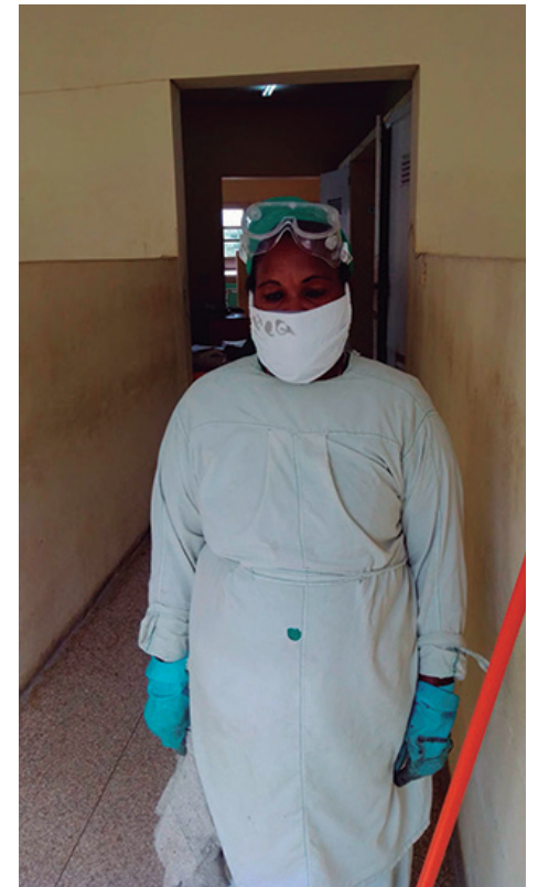
Las medidas de bioseguridad dentro de la institución hospitalaria son muy rigurosas para evitar cualquier contagio

Quizás su propio vínculo desde la prudencial distancia con los pacientes la hace una mujer distintiva. "Me comunico