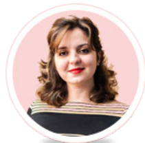
Por: Yanetsy Ariste

Algo importantísimo: sé ejemplo. Ellos nos están mirando todo el tiempo aunque no lo notemos. Perciben cómo somos, qué nos gusta, cómo interactuamos con los demás, qué nos afecta, qué nos maravilla... y nos imitan. Los padres somos el primer modelo social que un niño recibe; de nuestra conducta dependerá su futuro.