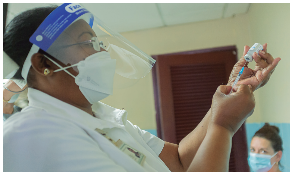
Las enfermeras preparan cada inyección con extremo cuidado y rigor

guerrillero ÓRGANO DEL COMITÉ PROVINCIAL DEL PCC EN PINAR DEL RÍO