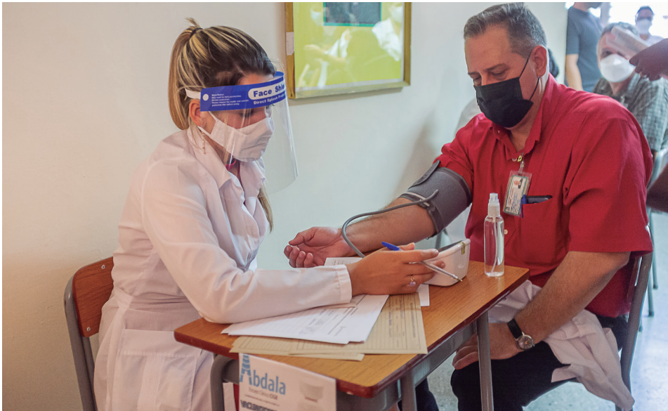
En el "Abel Santamaría" se hace un examen riguroso del paciente antes de proceder con la vacunación

Por: Dorelys Canivell Canal