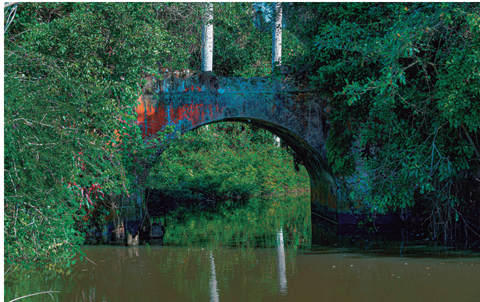
El puente a pesar de los años mantiene un excelente estado de conservación y aún sirve de paso a los campesinos del lugar