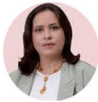
Por: Yolanda Molina Pérez

sencillo de entender, ¿entonces, por qué nos cuesta tanto?