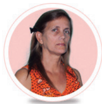
Por: Ana María Sabat González

los demás, su forma de pensar y actuar, y sobre todo, sus derechos en la sociedad.