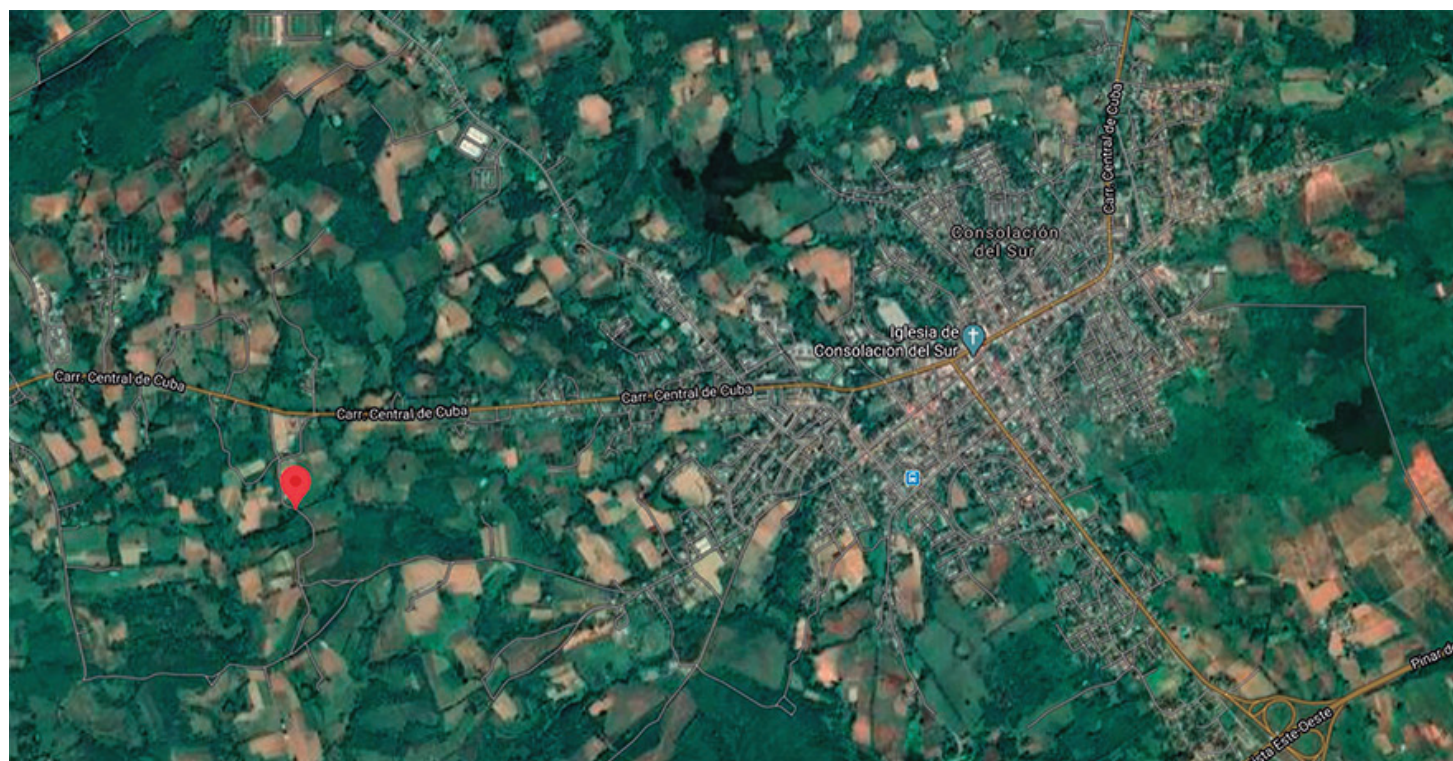
Vista satelital de la locación del puente, geográficamente establecido a los 22°29'52.7" de latitud norte y los 83°32'41.6" de longitud oeste

Sin embargo, aún no existe un criterio o investigación sólida que corrobore las afirmaciones anteriores. Sin otra construcción semejante en todo el trazado del mencionado Camino Real a la fecha, Puente Blanco continúa siendo un mito distante que los historiadores deberán desentrañar.