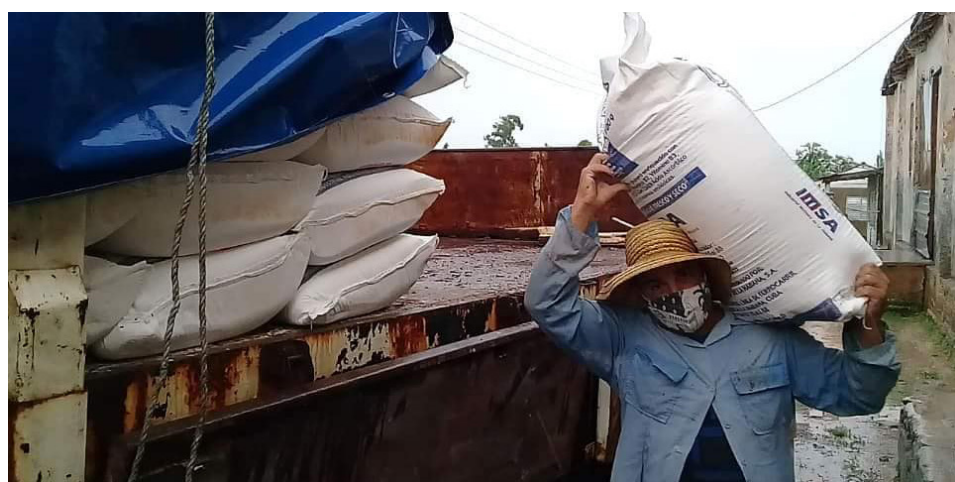
En La Palma, la protección inmediata de los recursos de la economía minimizó las pérdidas en el territorio