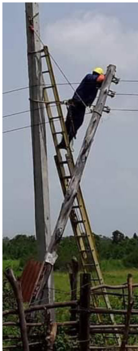
Brigadas de trabajadores eléctricos de otras provincias del país ofrecieron apoyo solidario a los pinareños