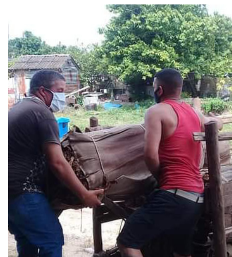
La temprana recepción del tabaco que había en los campos redujo posibles pérdidas de este rubro