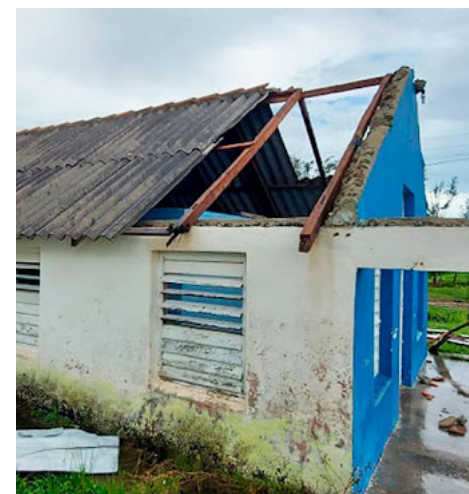
Gracias a la experiencia de otros huracanes que azotaron a la provincia, los daños a la vivienda no fueron significativos