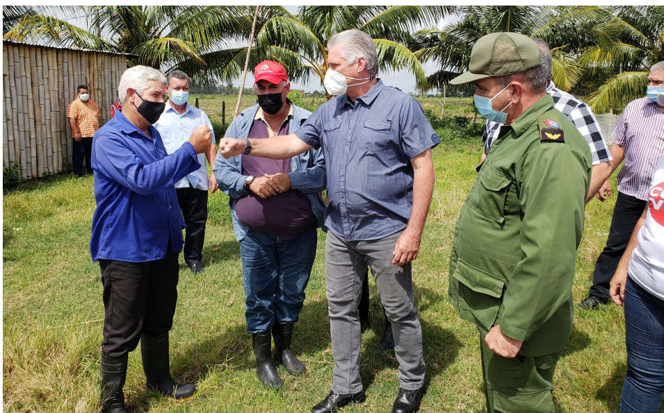
Miguel Díaz-Canel Bermúdez, primer secretario del Comité Central del PCC y Presidente de la República, visitó la provincia en la mañana del día 28 para evaluar los daños provocados por Ida

El huracán Ida tocó tierra pinareña en la noche del 27 de agosto, por Punta Carraguao y playa Dayaniguas, en la parte sur del municipio de Los Palacios y salió al mar por la porción norte de Viñales, específicamente Puerto Esperanza. Guerrillero se acerca a las huellas dejadas por este evento meteorológico