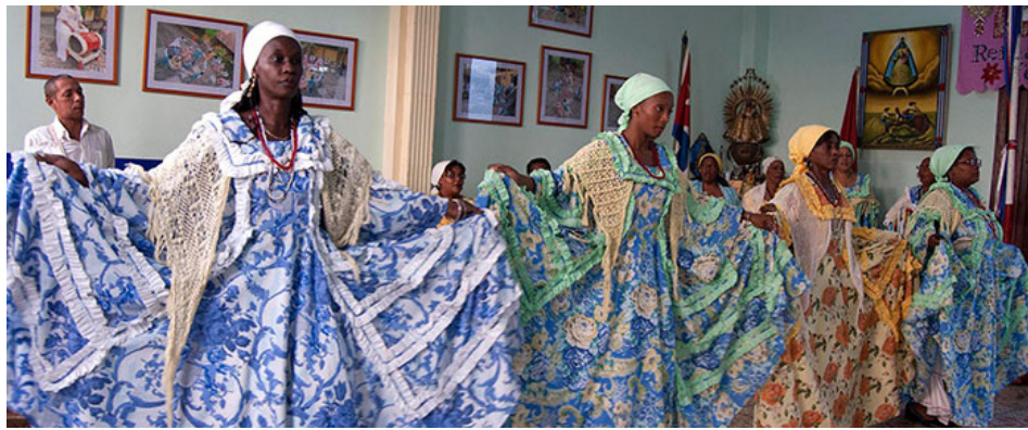
Tumba francesa: Obra Maestra del Patrimonio Oral e Inmaterial de la Humanidad