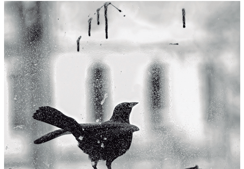
A través de la ventana, de Januar Valdés Barrios

también destacan dentro de la curaduría: en la serie de paisajes Solo la bruma sabe cuándo llegará su fin , Alain Cabrera ha enfocado el lente en una zona en el norte de Italia. Estas imágenes evocan la belleza bucólica y la serenidad natural. Pero el artista ha decidido manipular la imagen para provocar el efecto de la niebla y discursar así sobre la evolución espiritual del hombre frente a la naturaleza, o la naturaleza como personificación del camino existencial que debe ser recorrido y despejado.