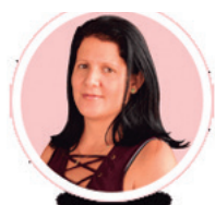
Por: Dainarys Campos Montesino

Que un atractivo espectáculo para niños en un centro cultural de la provincia se convierta, a punto de terminar, en zafarrancho de los padres para intentar acaparar adornos o globos de la colorida decoración, se torna tristemente pálido y empaña el resultado de lo que con mucho esfuerzo y amor se construyó.