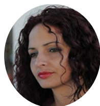
Por: Dorelys Canivell Canal

Hubo quien lo hizo por el solo hecho de estar vivos, por los que no lo lograron, por los que cuando parecía que no, se sobrepusieron a la enfermedad y hoy están entre nosotros, por cada médico, enfermera y voluntario que arriesgó su vida para que la nuestra estuviera bien,