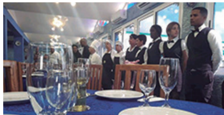
Parte del colectivo del Marlnit