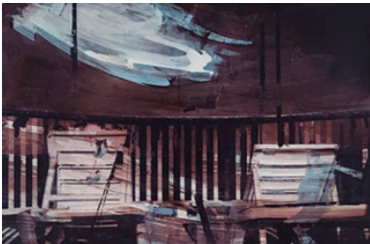
Leo de la O, en el perfil de Instagram Lafarmaciatelurica2