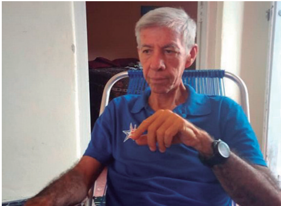
“Del pitcher tienes que saberlo todo y no solo sus cualidades deportivas... Sigue pasando que no nos ocupamos como se debe de la gente, de los atletas, y cuando dices eso te dicen que eres un contrarrevolucionario”, afirma Cortina

“En realidad, le veo más problema a las constantes visitas al box que a quitarlo rápido. A veces se le visita por gusto después de una acción positiva de él y eso puede sacarlo de la necesaria sistematización que lleva lanzar, porque el pitcher tiene que llevar su tiempo y su ritmo entre lanzamiento y lanzamiento y en ocasiones se le saca de tiempo y ritmo cuando