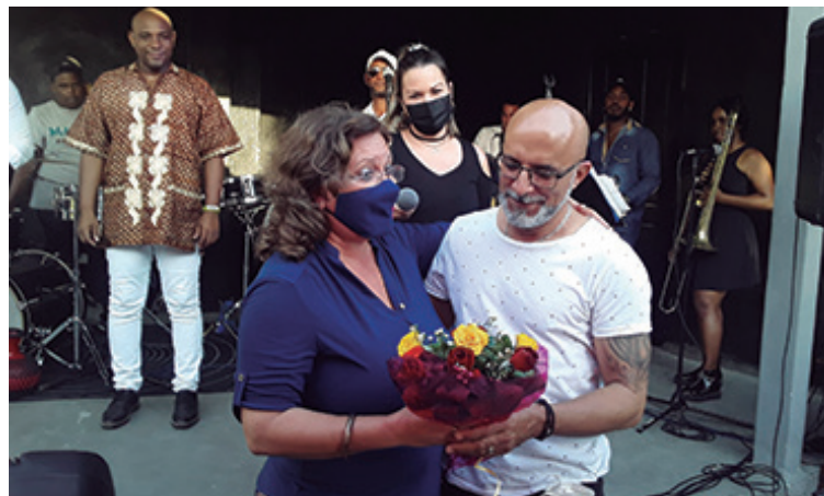
En la Uneac vueltabajera su colectivo y la Dirección Provincial de Cultura celebran su premio