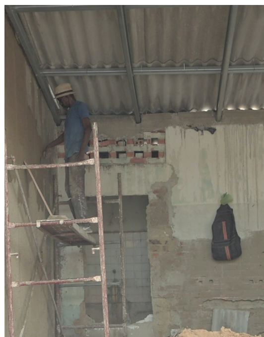
Son varios los sitios de San Luis donde hoy se acelera el ritmo de construcción

Impulsar el movimiento de los patios productivos, lo que tributa a eliminar solares yermos y ayuda al sustento familiar, se inserta entre los propósitos de la jornada, que es un acicate y estímulo en aras de nuevas metas que le confieran mayor calidad de vida a los sanluisenos.