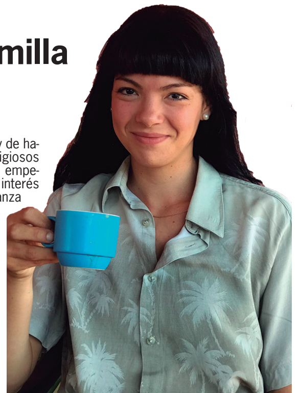
Aunque no discrimina colores, le servimos en la taza azul, porque: “... siempre me ha gustado la tranquilidad”

Al poco de enterarme del regreso, de verla recorrer con prisa graciosa las calles de nuestro pueblo en compañía de los retoños (o de William, el esposo habanero devenido palmero a ultranza), germinó la idea de este reportaje, que por razones inherentes al enigmático acto de la creación ha permanecido inconcluso hasta hoy. Por fortuna, no hay mal que por bien no venga,