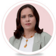
Por: Yolanda Molina Pérez

La inflación no es exclusiva de Cuba y la Tarea Ordenamiento, lo sabemos, pero nada de eso justifica que usted entre a uno de esos establecimientos en horario de servicio y varios pasillos estén obstruidos con mercancías apiladas o que comiencen a limpiar dos horas antes del