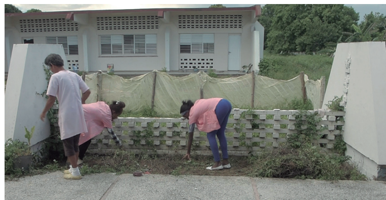
La limpieza y embellecimiento de todos los centros en el municipio involucra a los colectivos laborales de los diferentes sectores