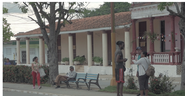
El paseo que atraviesa el poblado es sitio de encuentro casual, descanso y orgullo de los lugareños