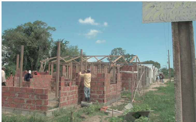
De las 12 viviendas que se edifican en "La Quimberia", siete serán para madres con tres hijos o más

Con una nueva ubicación, agrupadas para facilitar la urbanización y prestación de servicios a las mismas, se erigen una docena de inmuebles, lo que for-