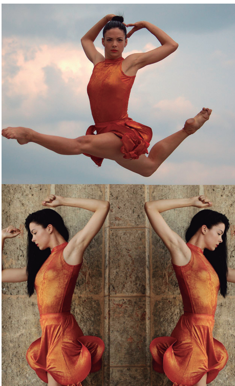
Recuerdos de su paso por el Ballet Nacional de Cuba

Al paso del tiempo descubrí que su presencia etérea se me hacía recurrente en las calles del pueblo, y un día supe, al indagar, que la chica de marras había logrado desarraigar de su entorno al marido, haciendo que se despegara la familia en pleno del barullo y los infinitos riesgos que en sus entrañas de urbe millonaria genera