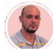
Por: Ariel Torres Amador

los recursos y las actividades deben gestionarse y movilizarse desde cada barrio, pensando siempre en estrategias de comercio y encadenamientos productivos con los diferentes actores socioeconómicos de cada Consejo Popular.