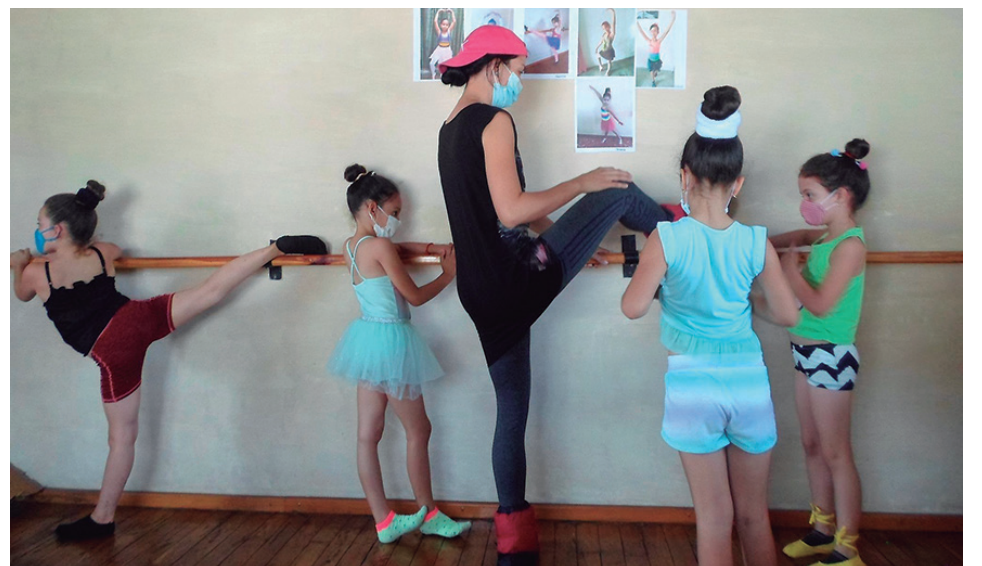
Primeros pasos de quienes pudieran llegar a ser reconocidas bailarinas