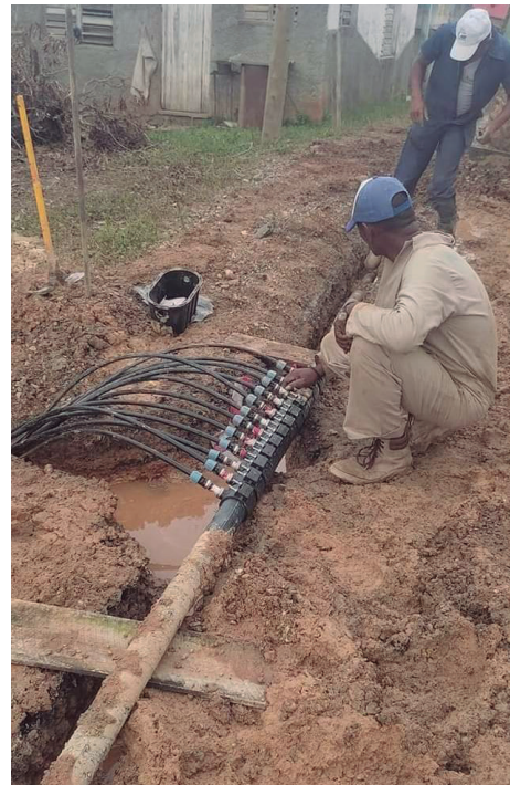
Con una red de 400 metros de tubería de 75 milímetros y 64 viviendas conectadas se trabaja por reducir los ciclos de agua en Minas de Matahambre.