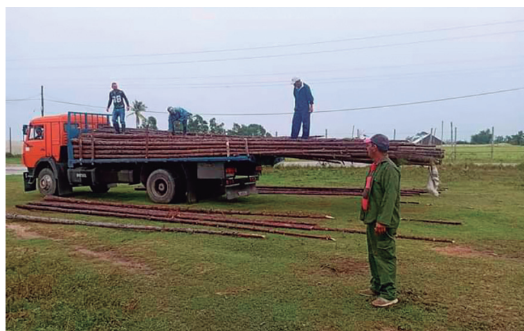
El apoyo de Transporte Agropecuario es fundamental para el traslado de las piezas de madera que necesitan los tabacaleros para reconstruir sus aposentos.

“Hoy nos resta por reparar tan solo una instalación de este tipo, los almacenes funcionan con normalidad y todos los volúmenes de hoja permanecen en lugares seguros para protegerlos y aplicarles un adecuado pro-