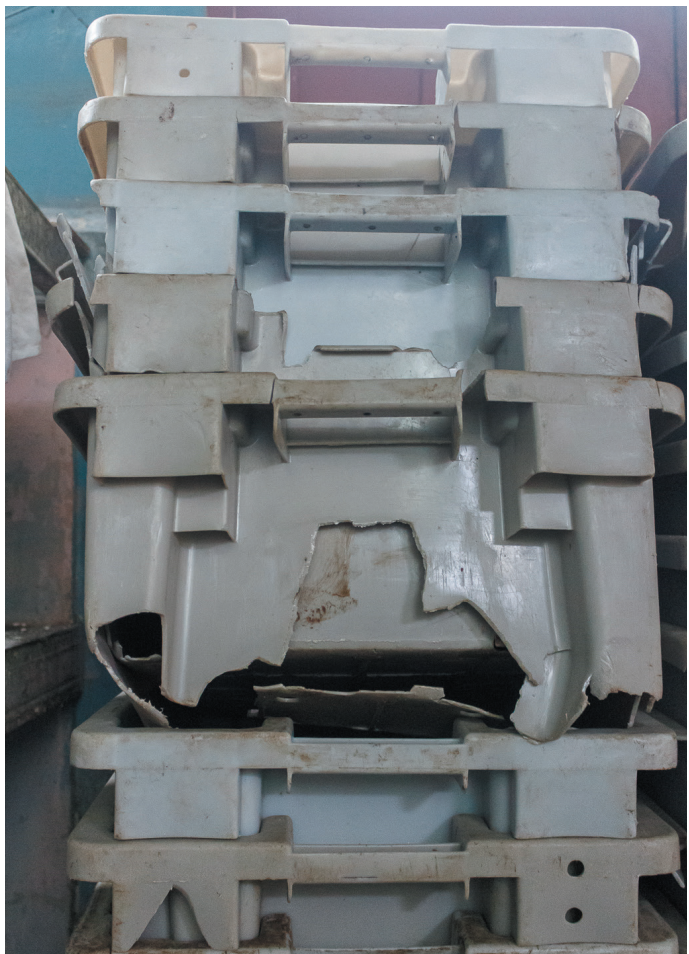
En esta situación se encuentran las cajas en las que se transporta el pan hacia las bodegas

“Aquí hay muchas cosas que nos perjudican, además de la calidad de la materia prima. El horno y los carros están en muy malas condiciones. También está el consumo eléctrico, ya a las 11 de la mañana hay que quitar la corriente, y de cinco a nueve de la noche otra vez.