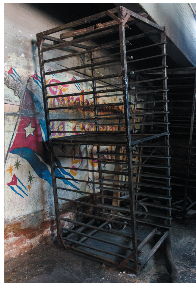
Las condiciones de trabajo y el estado de la tecnología en El Tomeguín son deplorables

La atención a los trabajadores en cuestiones salariales y de otra índole, al igual que las condiciones para su desempeño, son determinantes en la motivación y en el amor que le pongan a lo que hacen. Detrás de esa labor hay alguien que espera con necesidad y con el ansia de que llegue, “sin dolores”, el pan nuestro de cada día.