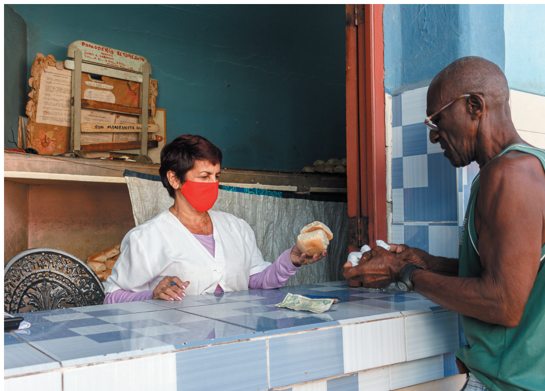
La inestabilidad en los horarios de expendio del pan es una de las insatisfacciones más frecuentes en la población

Sobre la higiene, la directora expuso que se debe controlar primero por el administrador, y que en cada unidad básica hay un especialista en Calidad que tiene que hacer los