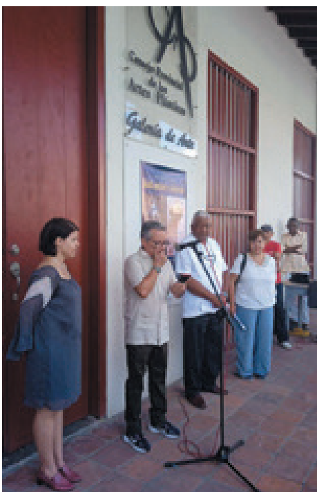
Las artes plásticas promueven el trabajo en las galerías

En medio de un contexto de crisis económica y tras el cierre de instituciones formadoras en la manifestación, Pinar del Río ha hecho un esfuerzo por mantener activas sus galerías.