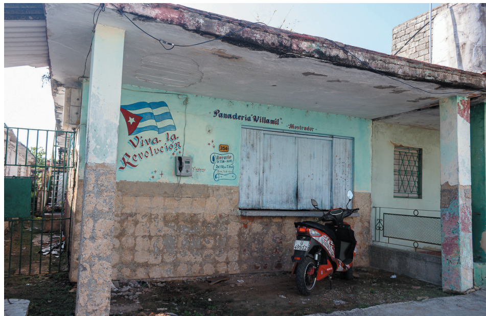
La panadería del Villamil lleva más de tres años en espera de una reparación

Agregó que hay innumerables quejas en cuanto al horario de la entrada del pan, a la calidad, al traslado del producto, y al porqué no se termina la