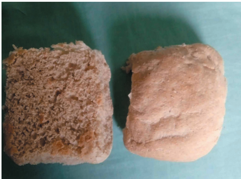
A pesar de la situación con las materias primas, la violación de procesos también influye en la calidad del producto final