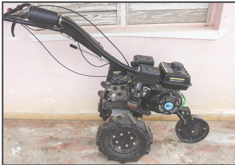
El proyecto Cuenca Resiliente ha beneficiado a varias mujeres campesinas de Guane con sistemas de riego e implementos para humanizar el trabajo en el campo

Conversamos en una casa de cura de tres aposentos, mientras amarra las hojas que llegan del campo. Con capacidad para