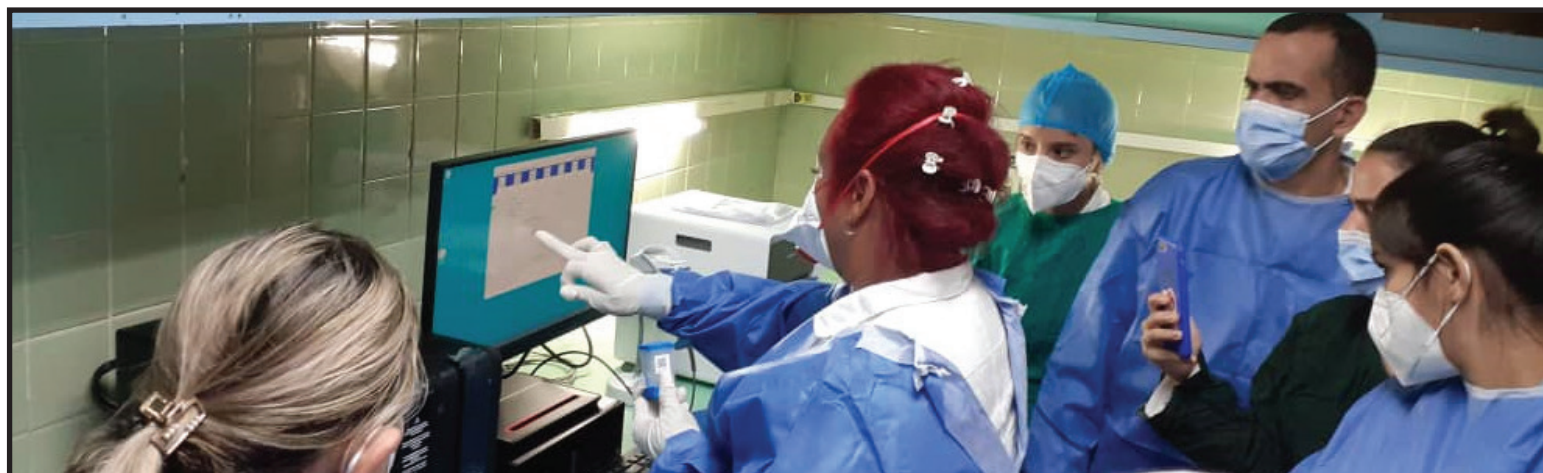
El Gene Xpert, un equipo que se utiliza para el diagnóstico rápido de TB y ver la resistencia a la rifampicina, fue instalado hace 15 días en Pinar del Río

En 1962 el PNCT inició una lucha incansable por transformar esta realidad, una vez que se