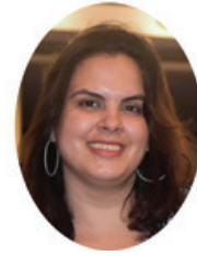
Por: India Alejandra González Molina

Tener conciencia de nuestra responsabilidad en el mundo, es el primer paso para poder tomar buenas decisiones, trazar un camino, plantear metas alcanzables y cumplir los sueños.