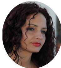
Por: Dorelys Canivell Canal

“La normalización, en sociología, es el proceso por el cual ciertos comportamientos e ideas se hacen considerar “normales” a través de la repetición, la ideología, la propaganda u otros medios, muchas veces llegando a tal punto que son consideradas naturales y se dan por sentado sin cuestionamiento”.