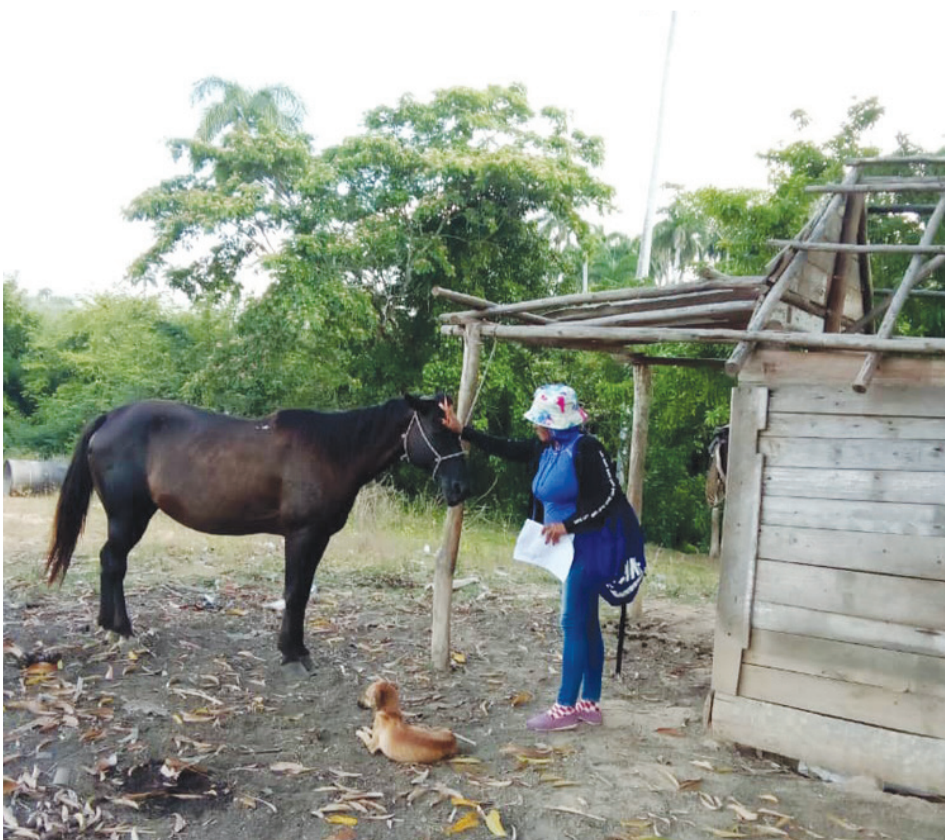
Es bien ardua la tarea de los inspectores pecuarios en el actual proceso de fiscalización que lleva a cabo el país

“La ganadería tiene cantidad requisitos, pero si se consigue estimular al campesino, que es quien lo ordeña, lo atiende, lo alimenta y lo cuida, podemos salir adelante”.