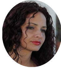
Por: Dorelys Canivell Canal

Hay cuentas de “bodeguero” que te desarman, que te exasperan y desesperan. Cuentas que más de un cubano asalariado ha sacado miles de veces sin que el resultado deje de ser siempre negativo.