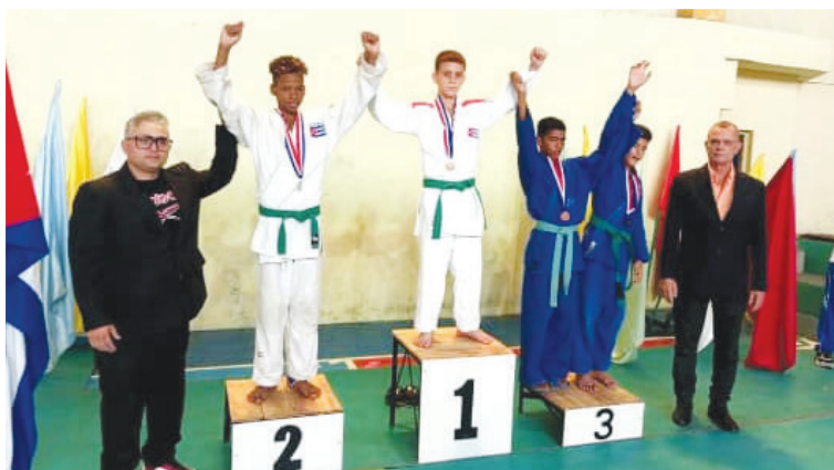
La polideportiva 19 de Noviembre será sede del judo escolar

Los Juegos Escolares Nacionales se estrenaron el 22 de agosto de 1963, con ocho deportes, en el "Eduardo Saborit", y la presencia del Comandante en Jefe. Aquel era un sitio en el que se apostaban grandes sumas de dinero en carreras de perros, pero después fue convertido en un campo deportivo para el disfrute del pueblo, como símbolo de los profundos cambios que impulsó la Revolución.