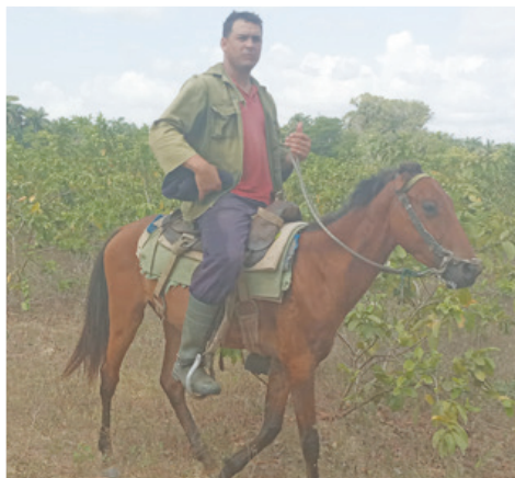
Hoy fomentan la producción de guayaba que procesan de manera artesanal para vender la pulpa a la población