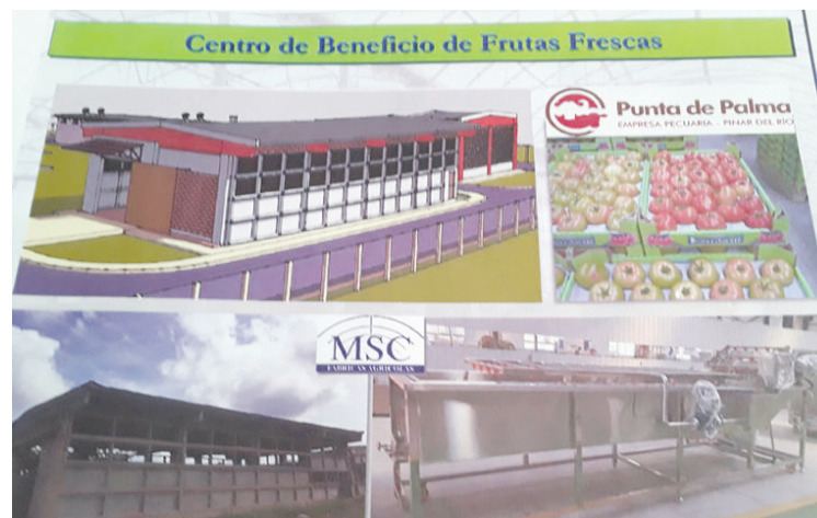
El proyecto con Emincar incluye una minindustria para el beneficio de frutas frescas y procesar residuos de cosecha

“Igualmente, tenemos una finca de desarrollo de novillas que tendrá capacidad para 250 cabezas de ganado, y trabajamos en la recuperación de una pollera en la zona de La Yuquilla, con tres naves con capacidad para