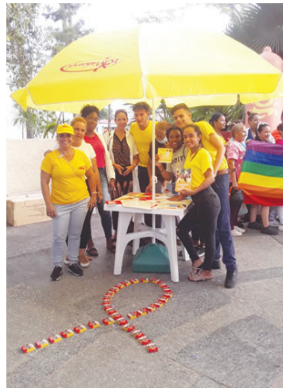
De forma sistemática, ProSalud y la Red de jóvenes por la vida realizan acciones de promoción de salud en diferentes espacios de la ciudad

Entre marzo y mayo se analizarán los resultados de la campaña. En aras de evaluar su impacto se revisarán los indicadores, se ajustarán las estrategias para lograr mejores resultados y se difundirán las experiencias y casos acertados en la toma de decisiones