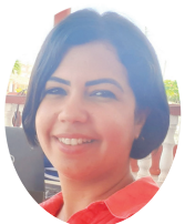
Por Claudia Ledesma

El “Paquito González” es el parque de todos. Sin importar el grado de solvencia económica de las familias, todas acuden allí en algún momento en busca de un rato de esparcimiento para los infantes