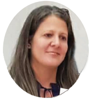
Por: Dainarys Campos Montesino

De que si el quiosco lleva semanas sin vender nada,