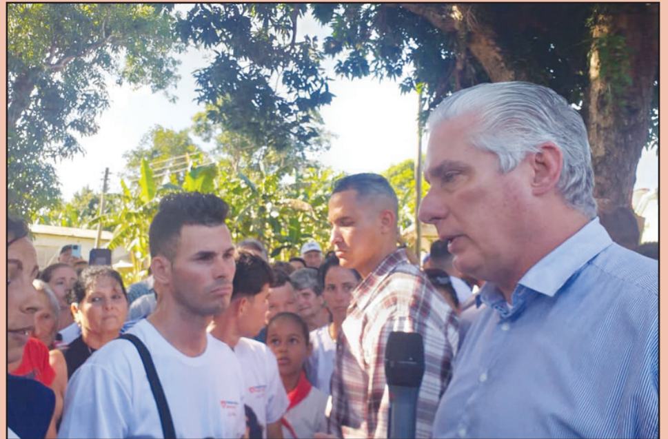
En intercambio con vecinos de la comunidad La Ceja, perteneciente al consejo popular Santos Cruz

Resaltó que todo lo que se haga debe llevar la mano de los palmeros, sus criterios, que exista participación popular, que se aproveche la ciencia, la innovación, que se exploten las alianzas con la Universidad de Pinar del Río Hermanos Saíz Montes de Oca, hasta lograr un sistema de trabajo de inmediato que permita también un adecuado control y evaluación de lo que se hace.