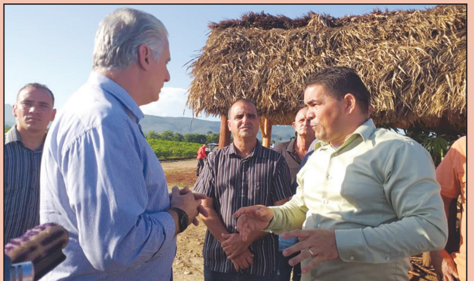
La Empresa Forestal La Palma tiene grandes posibilidades de revertir su situación económica en lo que resta de año