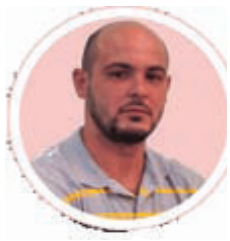
Por: Ariel Torres Amador

No es un secreto para nadie que la tendencia de hoy día es a la elevación constante de los precios de artículos, productos, bienes o servicios, siempre "amparados" bajo la ley de oferta y demanda, o el precio de una moneda que usamos y ni siquiera es nuestra.