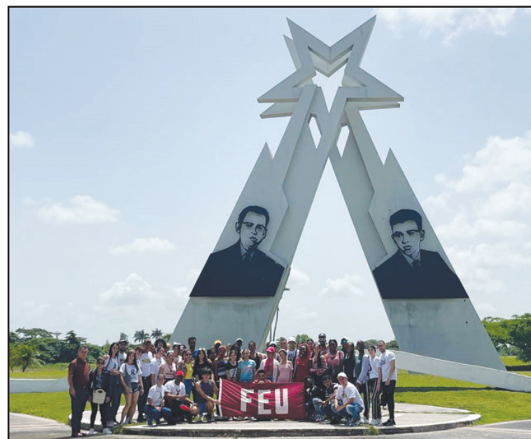
En el monumento a los Hermanos Saíz, de la universidad vuelta-bajera, iniciaron las actividades del campamento de verano