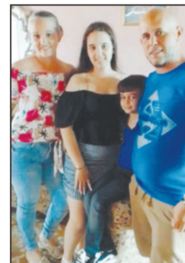
Estar lejos de su esposa y sus dos hijos es lo más difícil para este profesor pinareño