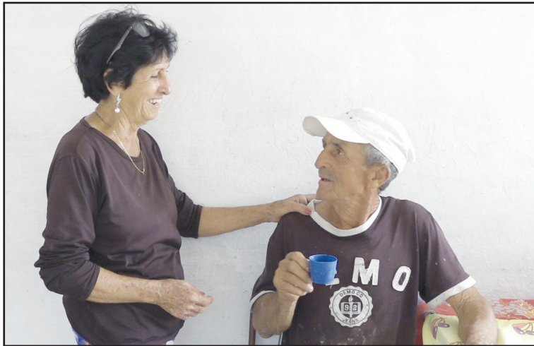
La comunicación es para esta mujer el pilar de la familia, y lo dice desde la experiencia de 48 años de feliz matrimonio

y "ayuda en todo lo que haga falta, porque la tierra es la que da todo".