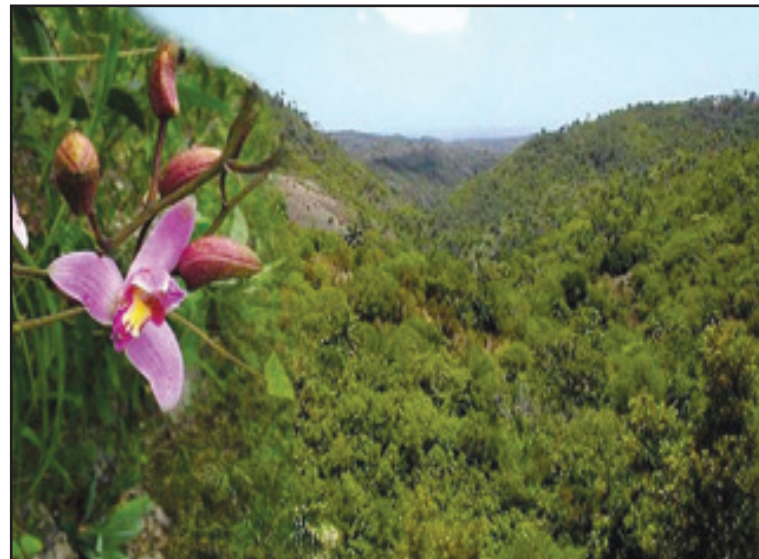
La Sierra del Rosario protege especies en peligro de extinción

Pinar del Río, con sus montañas, valles, ríos y costas es un modelo de conservación, pues aquí cada árbol que se mantiene en pie, cada especie que sigue viva, es una victoria.