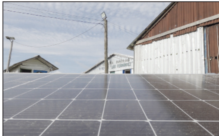
La instalación de módulos fotovoltaicos, tanto en escogidas familiares como estatales, garantiza la continuidad del proceso productivo