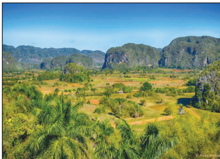
El Valle de Viñales posee una biodiversidad deslumbrante

Aquí, donde los mogotes parecen tocar el cielo y las tortugas encuentran su hogar, el futuro de la biodiversidad cubana sigue creciendo, protegido por la sabiduría ancestral y el respeto por la tierra que nos da vida.