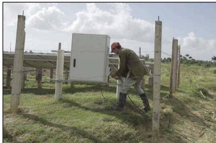
La instalación de paneles solares en posiciones de riego agrícola disminuye la demanda al Sistema Electroenergético Nacional

Justo es que quienes participan en el cultivo y procesamiento del tabaco, hasta la conformación de los mundialmente famosos habanos, se beneficien directamente de los ingresos que genera la rama conocida como el motor de la agricultura en Cuba.