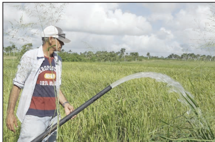
Aunque financiados con los ingresos que genera el cultivo del tabaco, los sistemas de riego alimentados con energía solar, también favorecen la producción de alimentos