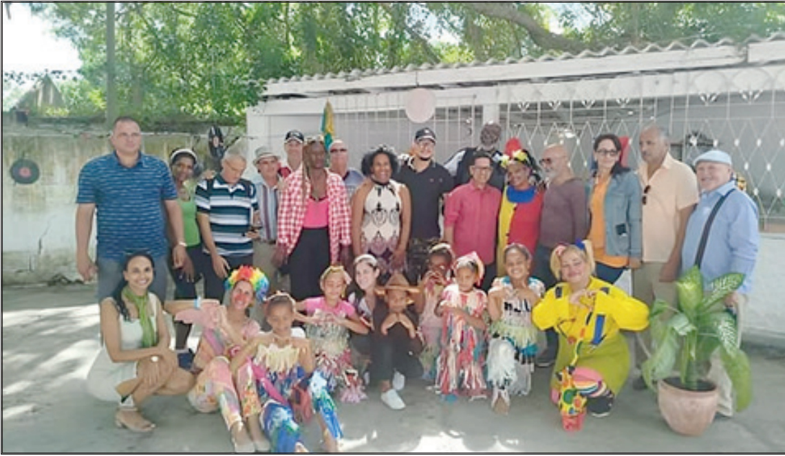
Previo al X Congreso de la Uneac, los delegados pinareños recorrieron varias instituciones y proyectos culturales, entre ellos, el sociocultural comunitario A puro corazón, del municipio de Guane

Histórico, trascendental, renovador, con esos calificativos, intelectuales de todo el país se han referido al X Congreso de la Unión de Escritores y Artistas de Cuba (Uneac), cuyas sesiones finales tienen lugar en La Habana este primero y dos de noviembre.