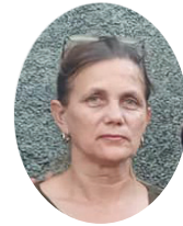
Por: Ana María Sabat González

Una mujer violentada, tan solo una, es una derrota. Con esta óptica se debe trabajar el tema, un fenómeno que constituye una problemática a la que hay que darle todavía más atención y tratar de que se cumpla lo que está estipulado.