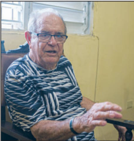
Al decir de Francisco Alonso, la orquesta enriquece cada presentación de la compañía lírica Ernesto Lecuona

La compañía de teatro lírico Ernesto Lecuona, no solo es la más antigua de su tipo en el país sino también la única en contar con una orquesta propia, desde hace ya 60 años.