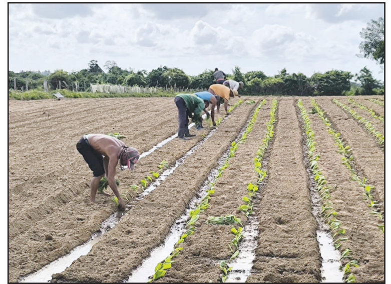
Entre noviembre y diciembre se prevé sembrar el mayor volumen de las hectáreas pactadas

“Además del cambio de matriz energética en los sistemas de riego y en la preindustria, se decidió también venderles paneles solares a los productores agrícolas. Solo en este mes de noviembre se han vendido más de 200, y se prevé 1 000 más antes de que finalice el año”, concluyó.