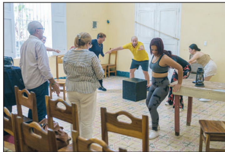
Al momento de nuestra visita, se ensayaba la obra A mucha honra , insertada en el repertorio de la Compañía hace algunos años. También conocimos del estreno de la puesta Azul Infinito en fechas cercanas

A sus 60 años, la orquesta acompañante del lírico pinareño constituye una hermosa metáfora de resistencia y arraigo. En medio de adversidades, es preciso continuar resguardándola de todo mal, con el mismo tesón con que cuida la madre de sus hijos.