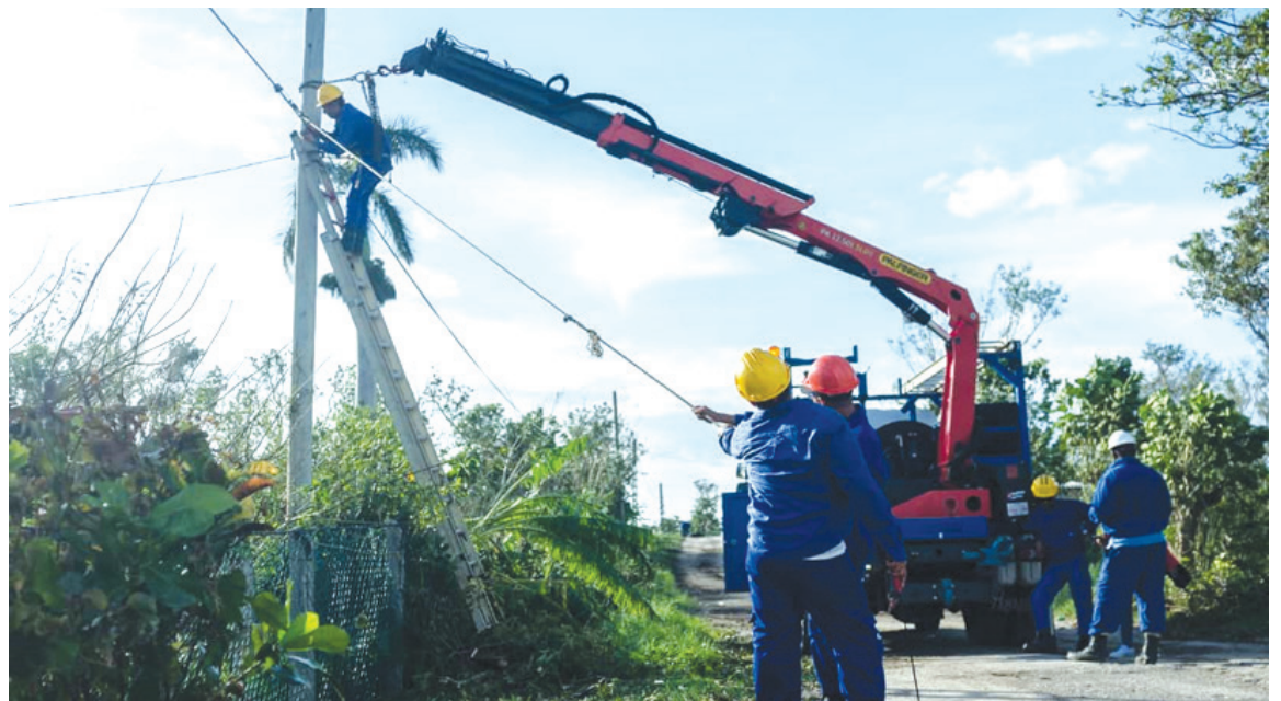
Desde las primeras horas de la mañana el camión grúa recorre cada una de las calles y caminos de la comunidad

La ayuda no será la solución a sus problemas, pero sí un aliado, que siempre contribuye a sanar.