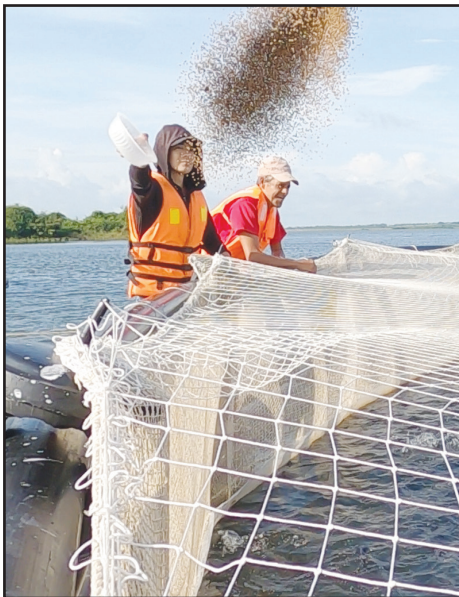
Los vietnamitas aportan asesoría y financiamiento para este proyecto que concluirá en el 2026

Por Yolanda Molina Pérez