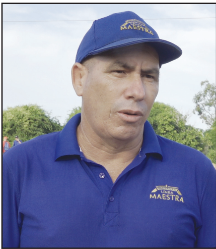
Por Dainarys Campos Montesino

*En los meses de noviembre y diciembre se concentra el grueso mayor de las plantaciones de la campaña 2024-2025