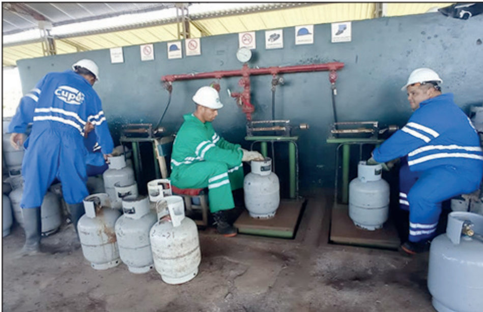
En la planta de llenado de GLP se trabaja para incrementar los ritmos productivos y satisfacer las demandas de la población

A partir de la entrada de materia prima, la planta de llenado de cilindros de Gas Licuado del Petróleo (GLP) de Pinar del Río incrementa sus ritmos productivos y logra cierta estabilidad, tras varias semanas en las que no se alcanzó a satisfacer las necesidades de los clientes.