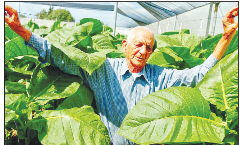
Alejandro Robaina, el Embajador del Habano, símbolo del tabaco cubano

El tabaco de Pinar del Río es una obra de arte en constante evolución, moldeada por la mano de quienes ven en él una extensión de su propia historia. Cada hoja que se seca en las vegas, cada habano que se elabora en las manos de un torcedor es un tributo a la perseverancia y al amor por esta tierra, que ha hecho del tabaco su razón de ser y de existir.