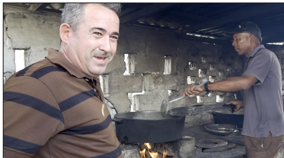
Solo ocho trabajadores laboran en el SAF y cubren su encargo social más la elaboración de varios cientos de raciones al día