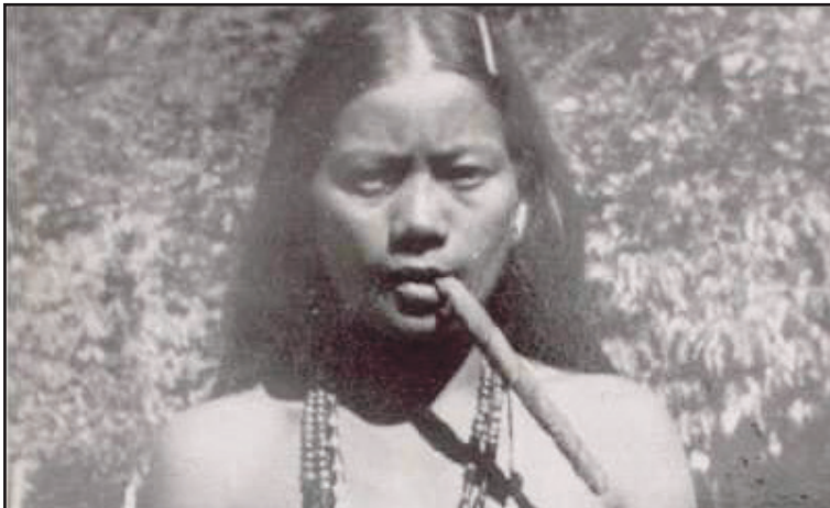
El tabaco, conocido y venerado desde las primeras civilizaciones indígenas de la Isla

Por generaciones, el tabaco ha sido mucho más que un cultivo en Pinar del Río: es una cultura, un legado y un símbolo de identidad. Desde los verdes valles donde crecen las hojas más finas hasta las casas de cura en las que se transforman en puros artesanales, se muestra un emblema de calidad y tradición. Pero, ¿cómo se convirtió este pequeño rincón de la Isla en la cuna del mejor tabaco del planeta?