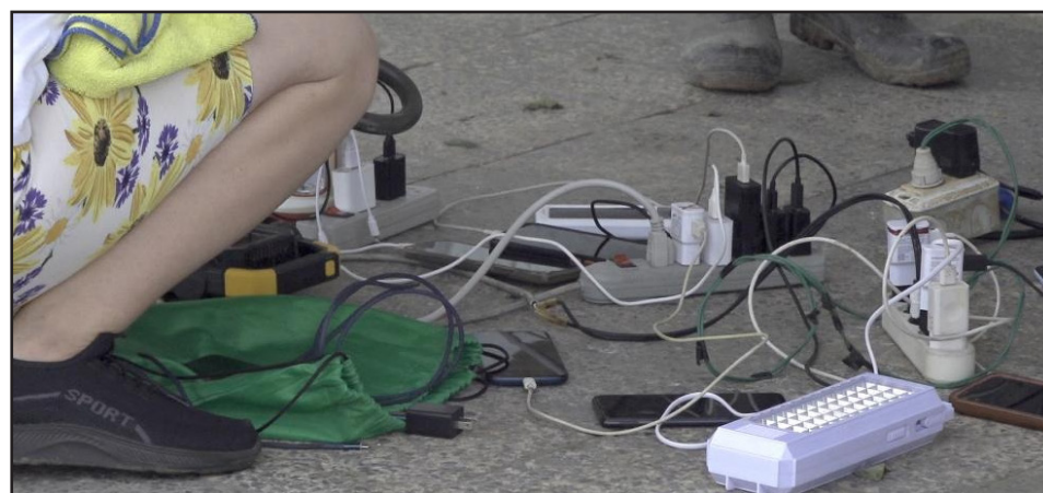
Con el uso del grupo electrógeno de la panadería se garantiza el pan de la canasta familiar y la carga de equipos

La trayectoria que finalmente recorrió el huracán Rafael sobre el territorio nacional dejó a Pinar del Río fuera de su área de impacto, incluso, en el municipio de La Palma, territorio limítrofe con Bahía Honda y ubicado a más de 70 kilómetros del punto por el que salió al mar este organismo tropical, hubo pocos efectos.