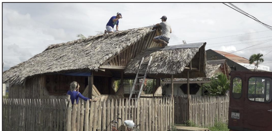
Asegurar los techos es una práctica eficaz que reduce pérdidas ante el embate de ciclones

Por Yolanda Molina Pérez