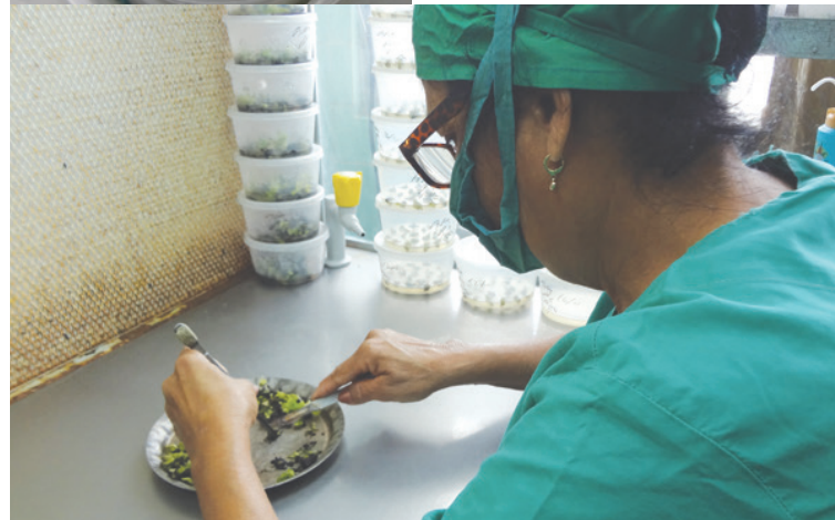
El trabajo de las operarias es uno de los más complejos de la instalación