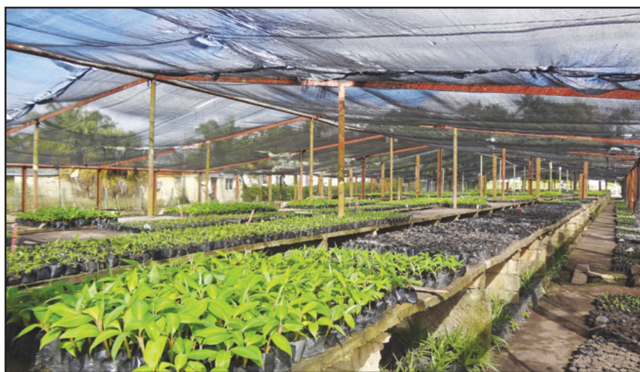
La producción de vitropiantas de plátano es uno de los objetos sociales fundamentales de SEBIOPINAR