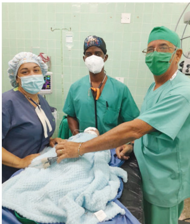
Parte del equipo médico que intervino en la cirugía de cataratas congénita el pasado 20 de noviembre.

a tiempo, aunque cada caso es uno, está descrito en los libros de Medicina que las cataratas monoculares tienen un pronóstico visual reservado, no así las que son binoculares, con un mejor pronóstico quirúrgico", señaló.