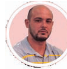
Por: Ariel Torres Amador

No es nada sencillo para el cubano promedio llenar la mesa cada día para su familia, independientemente de sus integrantes —entiéndase que, a mayor número de comensales, más difícil será el acopio y menor lo acopiado por aquello del salario promedio, los altos precios y demás—.