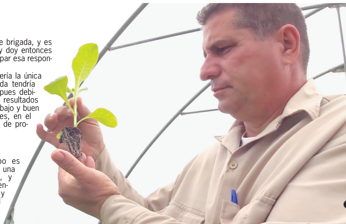
El estudio, análisis y vigilia constante de las posturas de tabaco Virginia hacen que su proyecto crezca cada día con mejores resultados

tos en recursos humanos y en el apartado de materiales y almacenes para poder controlar, planificar y obtener una campaña de siembra con todo lo necesario para no fallar.