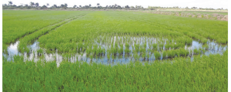
En áreas de la UEB Cubanacán se implementa un proyecto de cooperación con Vietnam que prevé la siembra de 5 000 hectáreas de arroz