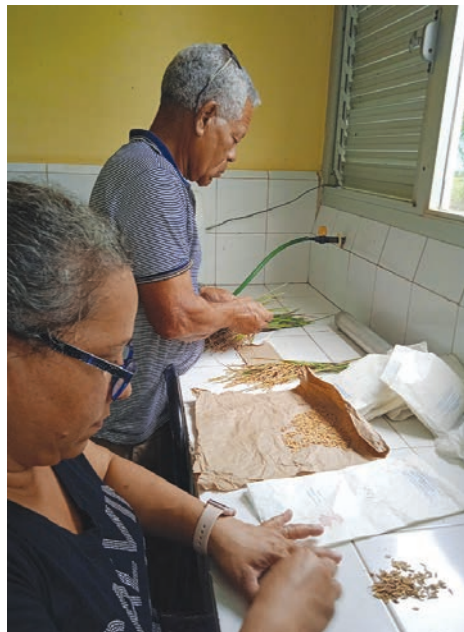
Variedades como el Inca LP-5 o el GINNES LP-18, creadas en la estación palacense, son las más comunes hoy en los campos del territorio

“Hoy trabajamos con tecnología de rebrote, con la rotación de cultivos arroz-soya, incluyendo la soja transgénica, la