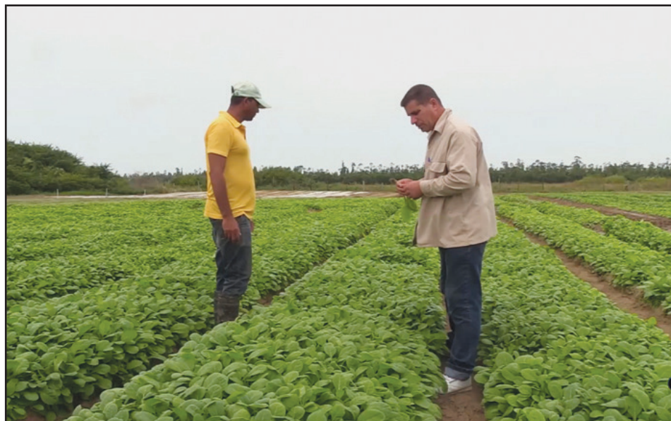
En el campo es donde le gusta pasar la mayor parte de su tiempo, pues confiesa que allí se siente más útil

“Mis inicios en la UBPC Julián Alemán fueron en 1993, recién salido del preuniversitario, y al año posterior, la coopera-