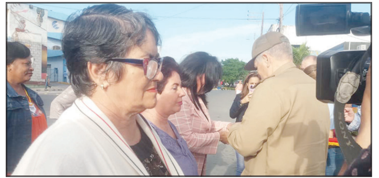
Entrega de sellos y carné a nuevos integrantes a la ACRC.