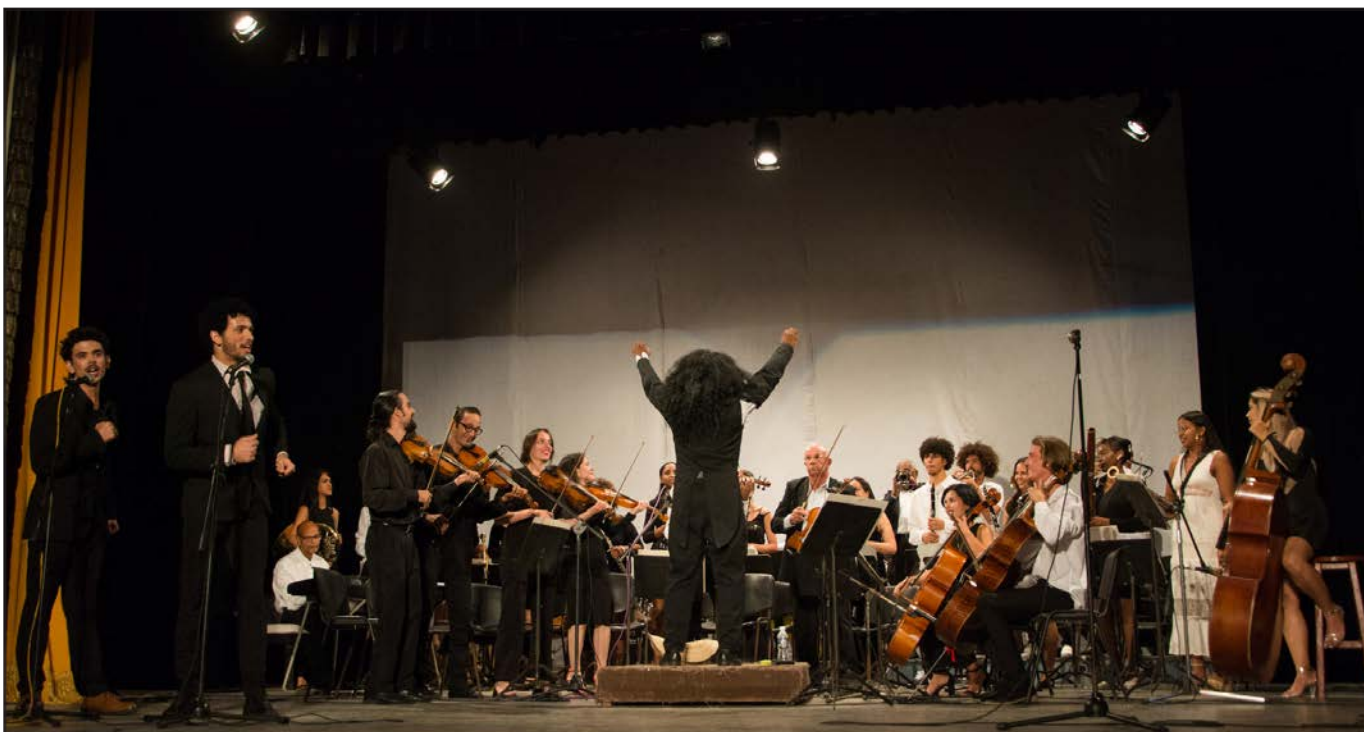
El espectáculo propició el reconocimiento a la orquesta acompañante del teatro lírico Ernesto Lecuona, en ocasión del aniversario 60 de su fundación