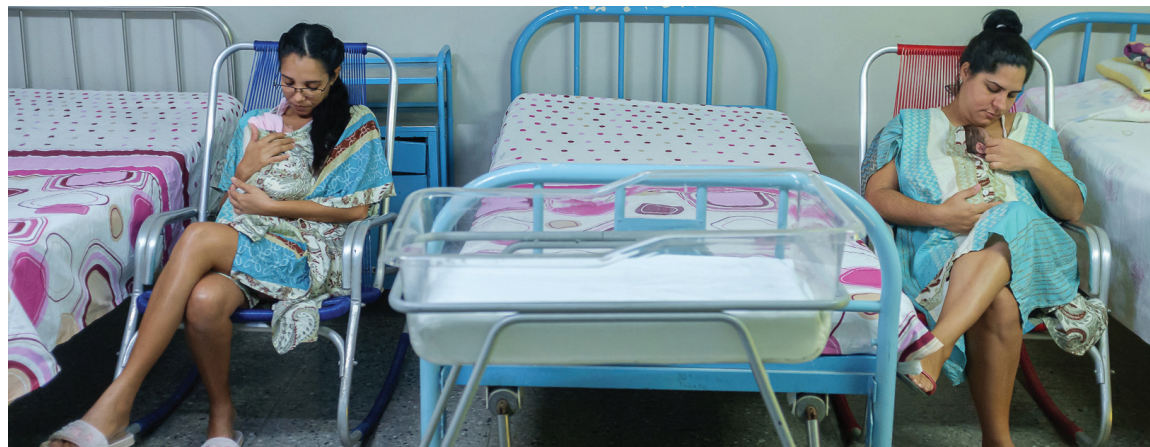
En la sala de Piel con piel se fomenta y fortalece la relación entre madre e hijo, toda vez que deben permanecer juntos la mayor parte del tiempo