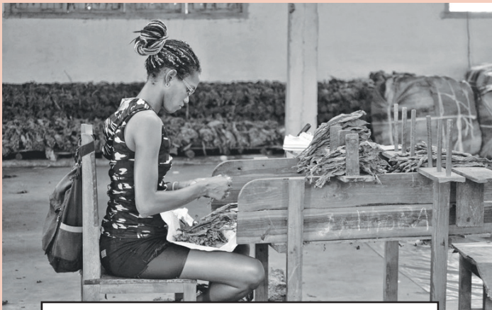
De la serie fotográfica Verde, que mereció el gran premio del concurso Jóvenes en el lente

Desde una jugada estelar en el partido de béisbol hasta videopoemas o escenas de profundo corte social, la cámara del joven artista se deja seducir en los más di-