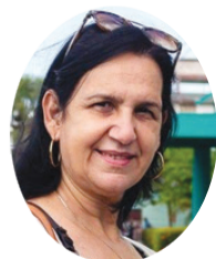
Por: María Isabel Perdigón

A medida que el reloj marque la llegada del nuevo año, los cubanos se encontrarán en una encrucijada cargada de pruebas, pero también de oportunidades. Y como tantas veces antes, el pueblo lo enfrentará con la esperanza de que los retos de hoy se conviertan en logros del mañana.