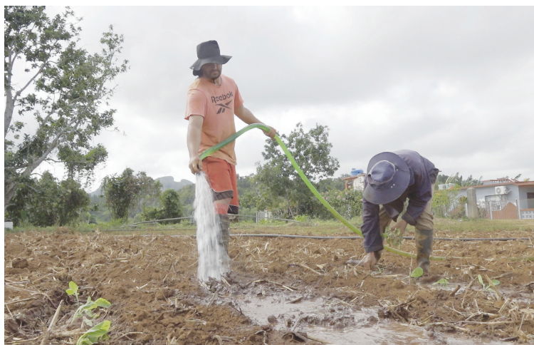
Incrementar el ritmo de siembra es el desafío urgente de los cosecheros palmeros

Diosvel sabe que es mucho el camino a recorrer, que se necesita un salto gigantesco, pero confía en las potencialidades y en que, paulatinamente, el tabaco se consolide como pilar de la economía del municipio. A los cosecheros de La Palma les toca liderar la transformación local, en aras de esa deseada bonanza que, como nación, esperamos.