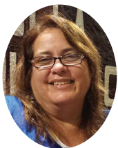
Por: Yolanda Molina Pérez

No obstante, lo que más lacera es la desesperanza, la pérdida de esa certeza de un hallazgo de luz en el futuro para que nos dé la fuerza necesaria en el presente para la construcción de un mañana promisorio. Activar el modo subsistencia tiene costos añadidos, y uno de ellos es perder de vista el porvenir.