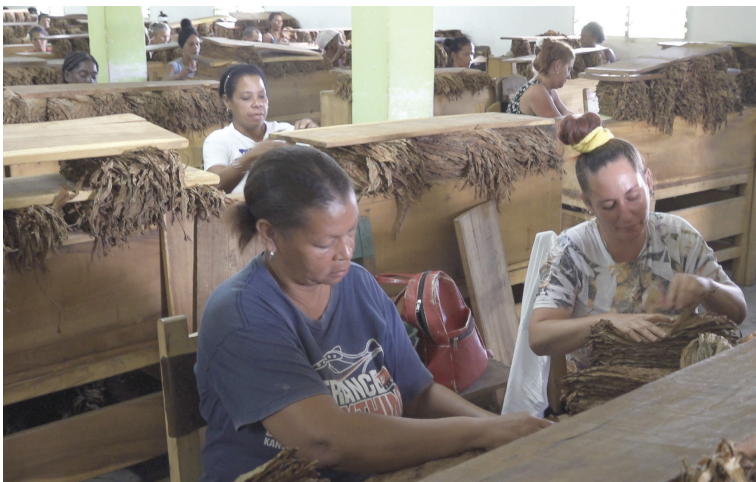
La disponibilidad de energía solar elimina las interrupciones por apagones en los centros de la preindustria

Por Yolanda Molina Pérez Fotos de Pedro Paredes