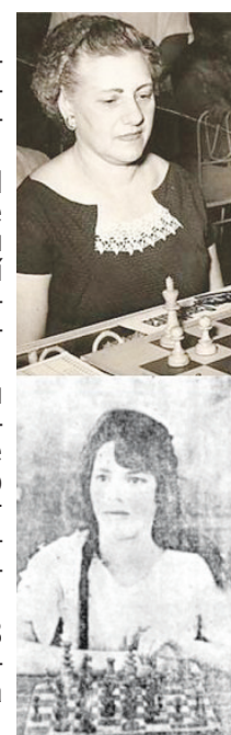
María Teresa Mora, alumna brillante de José Raúl Capablanca.

“Nació así esta copa online para homenajear a la figura de María Teresa Mora, alumna de José Raúl Capablanca y la primera WIM en Hispanoamérica. Es también un reconocimiento a las ajedrecistas cubanas, por su entrega, dedicación y resultados deportivos. Y por supuesto, es nuestro regalo a las madres, quienes festejarán su día el domingo 10 de mayo”,