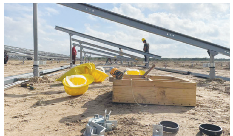
La conformación de las estructuras es impresionante, con una calidad y acabado óptimos

guerrillero ÓRGANO DEL COMITÉ PROVINCIAL DEL PCC EN PINAR DEL RÍO FUNDADO EL 6 DE JULIO DE 1969