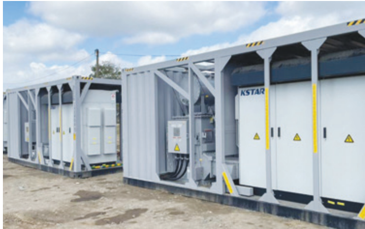
Ya se alistan los tres primeros inversores para, una vez servidas las mesas con sus paneles respectivos, comenzar a “inyectar” electricidad al SEN

Estos cuatro especialistas jóvenes provienen de La Habana, y ya cuentan en su haber con la