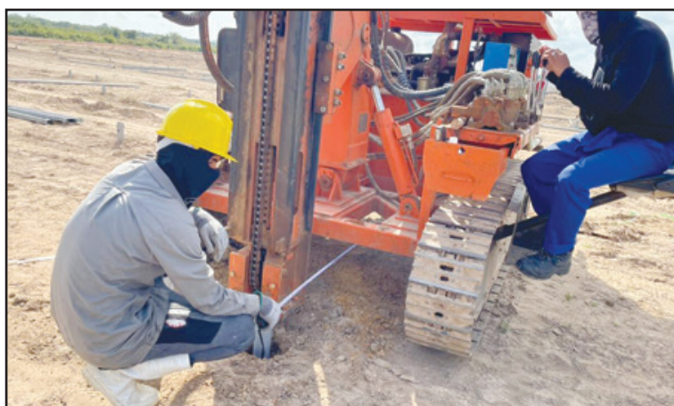
Cada medición en el terreno es de vital importancia para que no existan atrasos en los montajes posteriores

“Algo importante que debe conocerse es que en la provincia la demanda pico hasta las dos de la tarde está cerca de 110 o 115 megawatts, y completar estas estructuras nos daría parte de la soberanía energética suficiente para no depender completamente, durante esas horas, de diésel o motores de generación asociados. Por consiguiente, le estaríamos ahorrando al país millones de dólares de forma diaria”, concluyó.