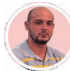
Por: Ariel Torres Amador

Amigo lector, realmente no sabe cuántas veces al día pensamos en usted los de al lado de acá de estas páginas. Para todos los colegas es igual... es una especie de relación de amor-odio –no hacia usted, a usted lo idolatramos– lo espinoso viene con la separación de la noticia, el chisme, lo noticioso y lo que a usted le interesa.