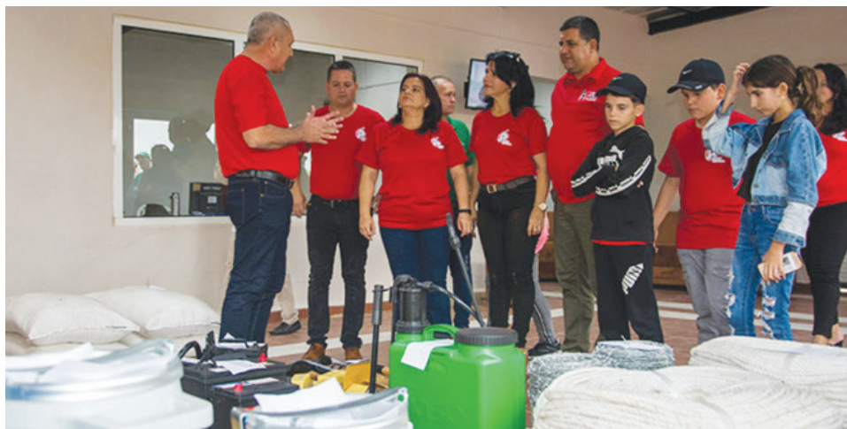
En Los Palacios quedó inaugurado el Centro Logístico Integral, perteneciente a Gelma, primero de su tipo en el país

Esta es una experiencia local que ha conseguido incrementar y diversificar sus producciones, ofrece empleo a jóvenes de la zona y facilita el proceso de bancarización.