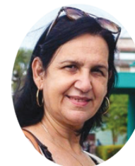
Por: María Isabel Perdígón

El seis de abril se celebra el Día Internacional del Deporte para el Desarrollo y la Paz, una fecha que subraya el papel esencial del deporte en la promoción de sociedades más justas, inclusivas y pacíficas. En este contexto, Cuba se destaca como un ejemplo emblemático de cómo el deporte puede ser un motor de transformación social y desarrollo humano.