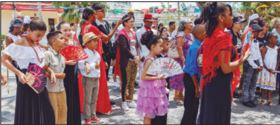
Pinar del Río, como provincia anfitriona, contó con una representación del movimiento danzonero en cada uno de sus municipios

El danzón, baile nacional de Cuba y patrimonio cultural inmaterial del país, reunió en Pinar del Río a adeptos de todas las edades. Como parte del encuentro fraternal Pinar Danzón 2025, coincidieron aquí niños, adolescentes, adultos, e incluso, adultos mayores, que han encontrado en ese género una filosofía de vida.