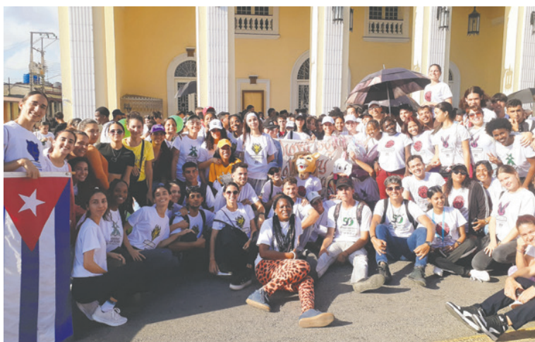
La juventud, siempre, debe parecerse a su tiempo

Hay jóvenes, como decía Yorlay, en todos los frentes, porque Cuba los necesita allí, donde son más útiles, más necesarios.